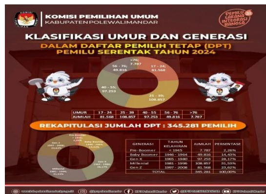
Gambar 2. Klasifikasi Umur dan Generasi dalam DPT Pemilu 2024 Kabupaten Polewali Mandar

Berdasarkan data dari Komisi Pemilihan Umum (KPU) rentang umur 17-24 dalam daftar pemilih tetap (DPT) pemilu 2024 sebanyak 81.568 atau sekitar 23% dari total daftar pemilih Kabupaten Polewali Mandar tahun 2024, jumlah pemilih dari tetap di Kabupaten Polewali Mandar. Meskipun data ini tidak merinci jumlah pemilih di setiap kecamatan, khususnya di Kecamatan Polewali, segmen ini tetap relevan sebagai informan dalam penelitian ini, mengingat jumlah partisipasi mereka yang sangat signifikan di wilayah ini. Adapun informan pada segmen ini yaitu 10-12 Orang.