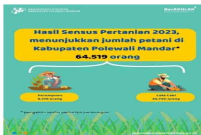
Gambar 4. Jumlah Petani di Kabupaten Polewali Mandar tahun 2023

Berdasarkan data dari Badan Pusat Statistik Kabupaten Polewali Mandar, sektor pertanian dan perikanan merupakan sumber penghasilan utama masyarakat di Kecamatan Polewali. Petani dan Nelayan menjadi kelompok mayoritas di kecamatan ini sehingga dipilih menjadi informan dalam penelitian ini karena jumlah mereka yang signifikan di kecamatan ini. Adapun jumlah informan pada segmen ini yakni 5-6 informan.