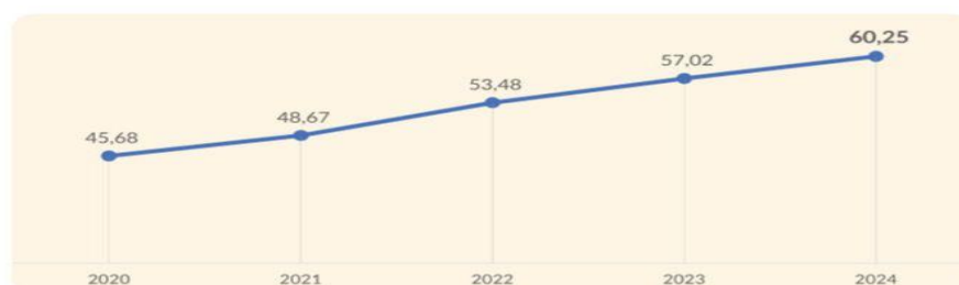
Gambar 3. PDRB Per Kapita Kabupaten Bone tahun 2020-2024 (juta rupiah)

Sementara berdasarkan data Struktur PDRB Kabupaten Bone menurut lapangan usaha atas dasar harga berlaku pada tahun 2024 tidak menunjukkan perubahan berarti. Perekonomian Kabupaten Bone masih didominasi oleh Lapangan Usaha oleh Pertanian, Kehutanan, dan Perikanan sebesar 48,38 persen; Perdagangan Besar-Eceran, Reparasi Mobil dan Sepeda Motor sebesar 11,57 persen; Konstruksi sebesar 10,61 persen; dan Industri Pengolahan sebesar 7,16 persen. Peranan keempat lapangan usaha tersebut dalam perekonomian Kabupaten Bone mencapai 77,72 persen.