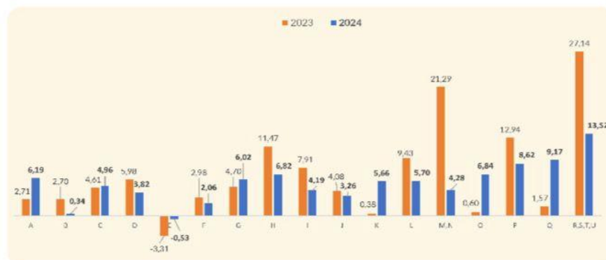
Gambar 1. Pertumbuhan Produk Domestik Regional Bruto (PDRB) Menurut Lapangan Usaha Kabupaten Bone tahun 2024 (persen)

Di Sulawesi Selatan terdapat 24 kabupaten/kota, namun yang direncanakan secara spesifik sebagai sentral budidaya pisang Cavendish di Sulawesi Selatan adalah Kabupaten Bone yang memiliki kondisi tanah dan iklim yang sangat mendukung untuk pertumbuhan pisang Cavendish. Kabupaten Bone selain potensi yang besar juga mempunyai dukungan regulasi yang kuat, yaitu Peraturan Daerah Kabupaten Bone tentang Lahan Pertanian (PERDA) Nomor 9 Tahun 2022 yang mengatur tentang pengelolaan dan perlindungan lahan pertanian serta mendukung petani untuk meningkatkan produktivitas dan kualitas hasil pertaniannya. Selain itu dalam upaya memperkuat kapasitas penerapan standar pertanian, Balai Besar Penerapan Alat Pertanian Standar (BBSIP) Kabupaten Bone juga melibatkan penyuluh dan petani dalam penerapan teknologi pertanian yang memenuhi standar yang telah ditetapkan. Hal ini bertujuan untuk memastikan bahwa Budidaya Pisang Cavendish di Kabupaten Bone tidak hanya mengandalkan potensi alam, tetapi juga didukung oleh praktik pertanian yang baik dan berkelanjutan untuk meningkatkan perekonomian di Kabupaten Bone.