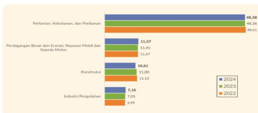
Gambar 2. Struktur Produk Domestik Regional Bruto (PDRB) Menurut Lapangan Usaha Kabupaten Bone tahun 2022-2024 (persen)

Berdasarkan data Badan Pusat Statistika (BPS) Kabupaten Bone 2025, terlihat perekonomian Kabupaten Bone tahun 2024 dibanding tahun 2023 mengalami pertumbuhan sebesar 5,55 persen. Pertumbuhan positif terjadi pada hampir semua lapangan usaha, kecuali lapangan usaha Pengadaan Air, Pengelolaan Sampah d, Limbah dan Daur Ulang yang mengalami pertumbuhan negatif (kontraksi) sebesar -0,53 persen. Adapun lapangan usaha yang mengalami pertumbuhan tertinggi adalah Jasa Lainnya sebesar 13,52 persen dan Jasa kesehatan dan Kegiatan Sosial Lainnya sebesar 9,17 persen. Sebanyak 6 lapangan usaha mengalami pertumbuhan positif dan tumbuh lebih cepat pada tahun 2024 dibandingkan tahun 2023. Sedangkan 10 lapangan usaha mengalami pertumbuhan positif namun melambat jika dibandingkan tahun sebelumnya.