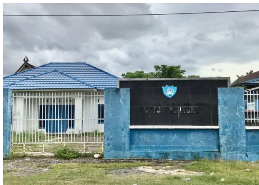
Gambar 2.3 Puskesmas Pembantu Desa Pajukukang

Berdasarkan pada tabel diatas menunjukkan bahwa pembangunan fasilitas kesehatan sudah mulai ada pada tahun 1983 di Desa Pajukukang tepatnya di Dusun Panaikang adalah Puskesmas Pembantu (Pustu) dan balai pengobatan. Pustu merupakan pelayanan kesehatan yang cukup memberikan pengaruh besar dalam pembangunan kesehatan. Selain itu, Pustu juga merupakan pusat pelayanan kesehatan masyarakat tingkat pertama dengan tujuan untuk memelihara dan meningkatkan kualitas kesehatan masyarakat serta mencegah penyakit khususnya di Desa Pajukukang.