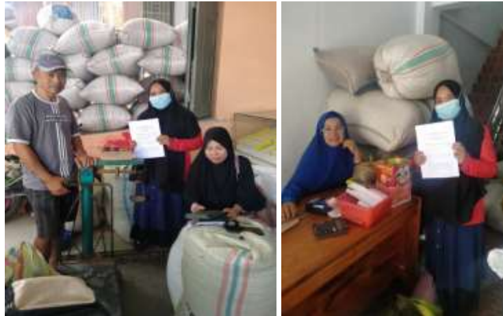
3. Wawancara dengan pedagang besar