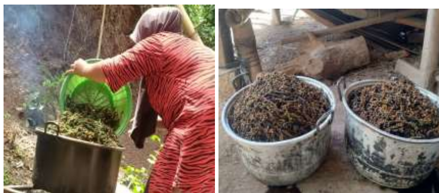
5. Proses Pasca Panen