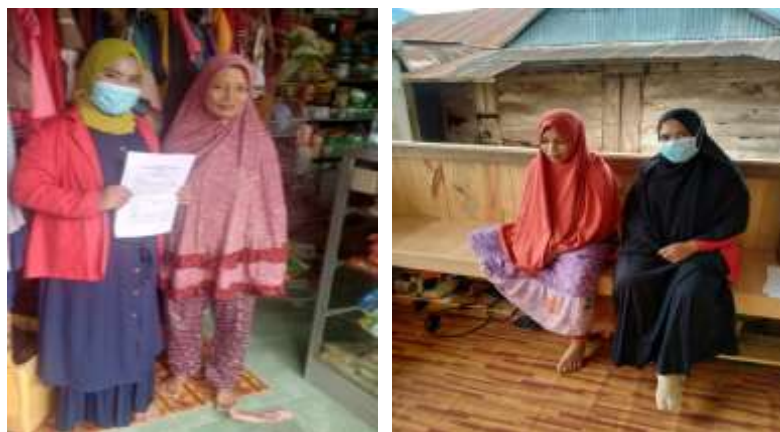
2. Wawancara dengan pedagang pengumpul