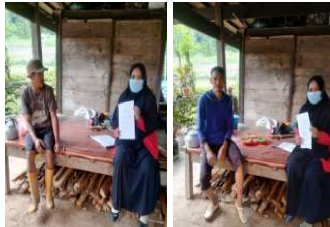
1. Wawancara penelitian dengan petani responden