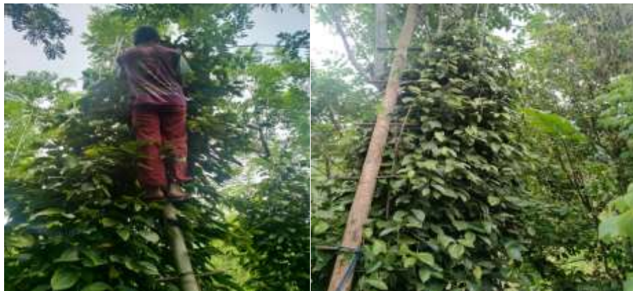
4. Proses Panen Lada