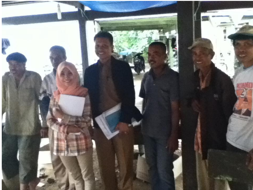
Foto Bersama Responden dan Sekretaris Dinas Pertanian Kabupaten Barru