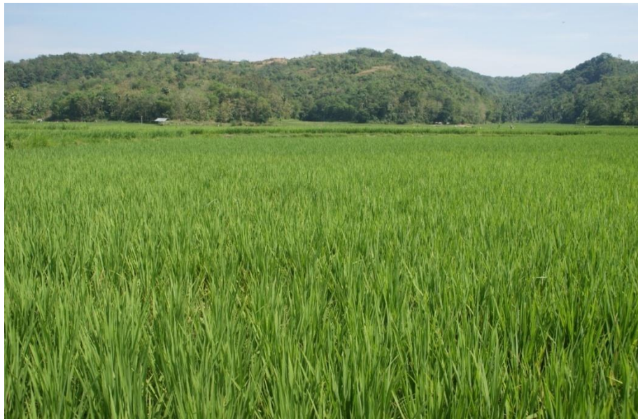
Hamparan Padi di Lokasi Penelitian