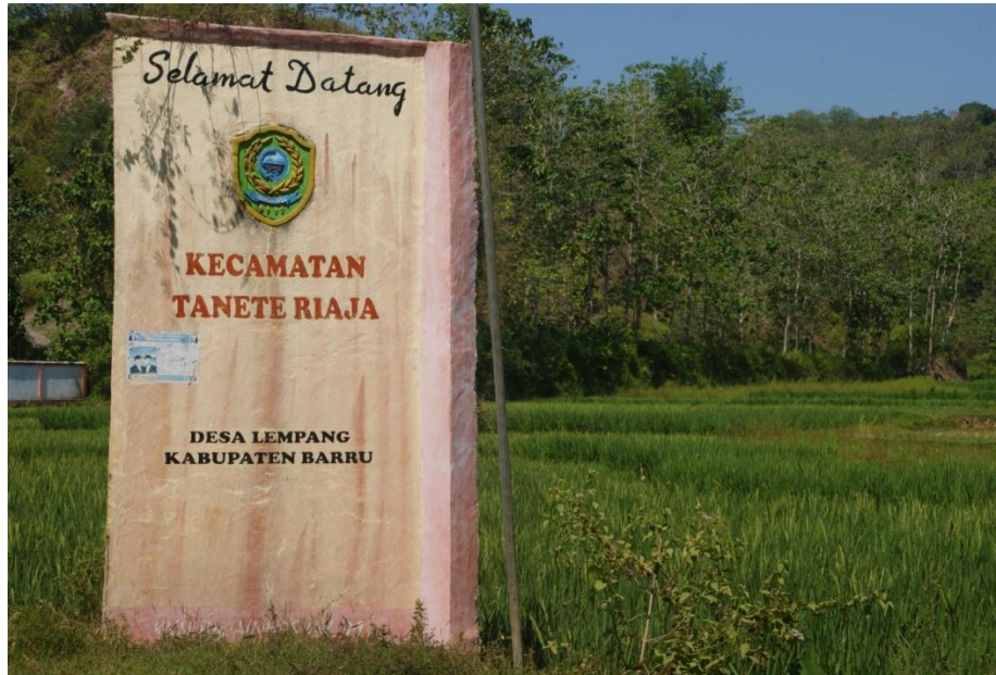
Pembatas Desa Lokasi Penelitian