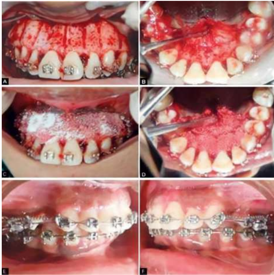
Gambar 2.1 (A dan B) Potongan corticotomy di sisi bukal dan palatal, (C dan D) Demineralized Freezed Dried Bone Allograft ditempatkan di atas pemotongan corticotomy dan (E dan F) retraksi dilakukan menggunakan pegas koil NiTi (Agarwal et al , 2014).