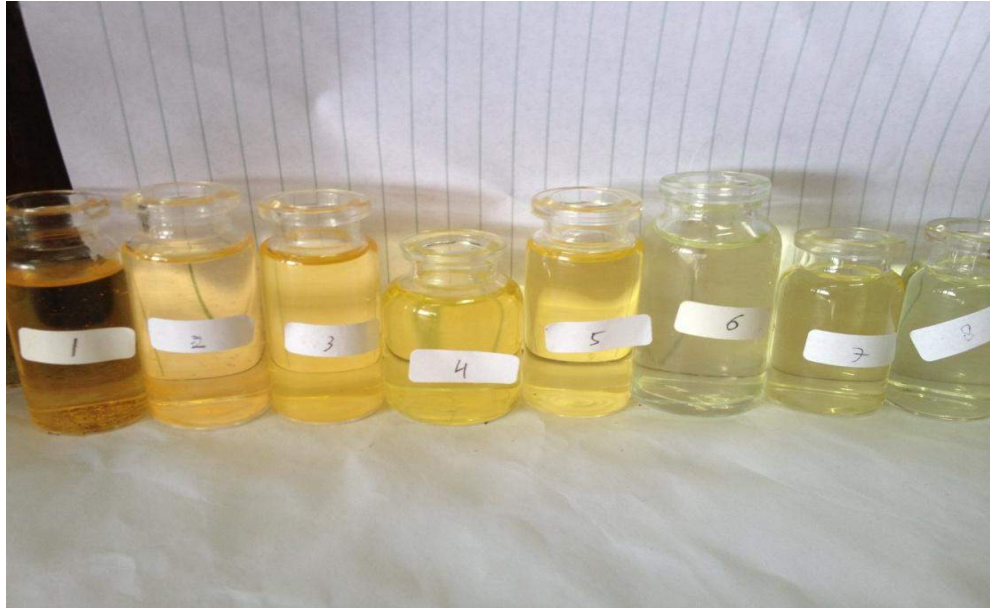
Gambar 12. Foto fraksi-fraksi ekstrak metanol Cabe jawa ( Piper retrofractum Vahl.) setelah di partisi menggunakan Sepacore