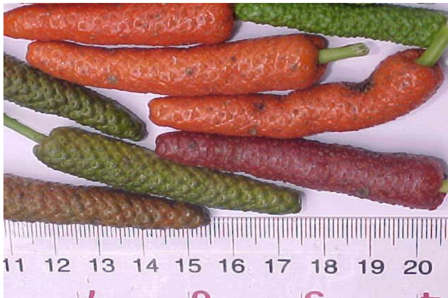
Gambar 9. Buah Cabe jawa ( Piper retrofractum Vahl.)