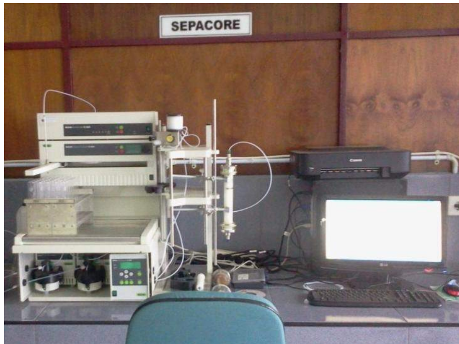
Gambar 11. Foto alat Sepacore (Buchi®)