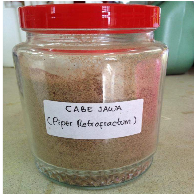
Gambar 10. Serbuk Cabe jawa ( Piper retrofractum Vahl.)