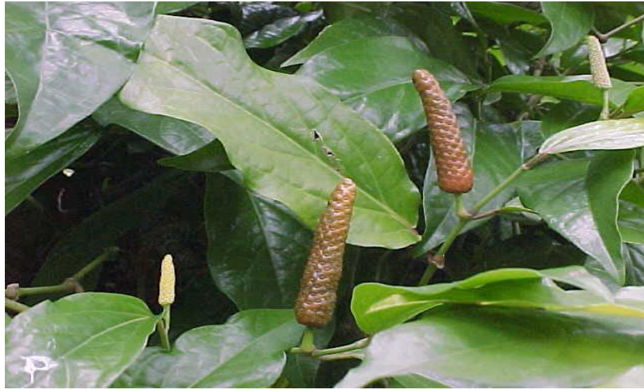
Gambar 8. Cabe jawa ( Piper retrofractum Vahl.)