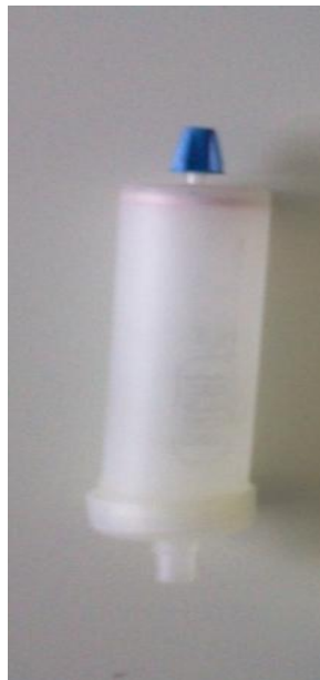
Gambar 13. Foto Catridge PP 12/150