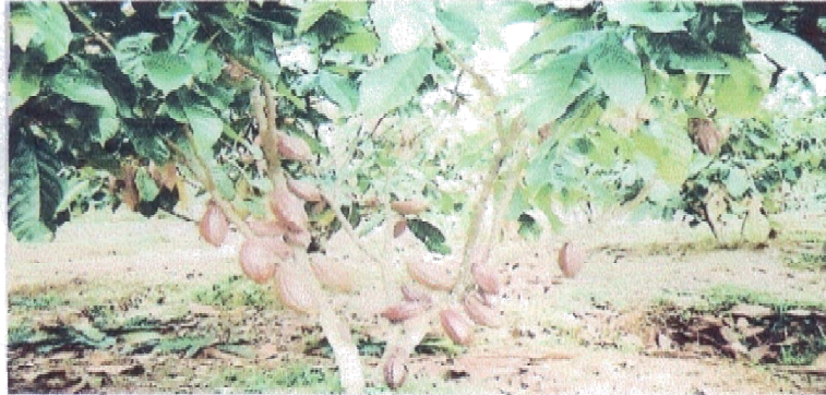
Lampiran 2. Foto kegiatan kakao di lapangan