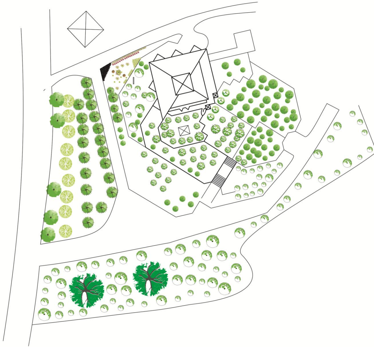
Lampiran 1. Tapak awal