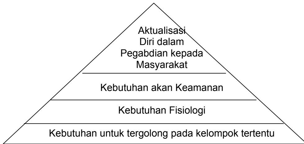
Gambar 1. Hierarki-hierarki kebutuhan berbeda dari kultur ke kultur. Sebuah contoh dari negara R.R.C (Nevis,1983) dikutip dari Winardi (2011)

kegiatan termasuk juga yang disebut bekerja. Urutan tersebut dari yang terkuat sampai yang terlemah dalam memotivasi terdiri dari : kebutuhan fisik, kebutuhan rasa aman, kebutuhan sosial, kebutuhan status/kekuasaan dan kebutuhan aktualisasi. (Nawawi, 2001).