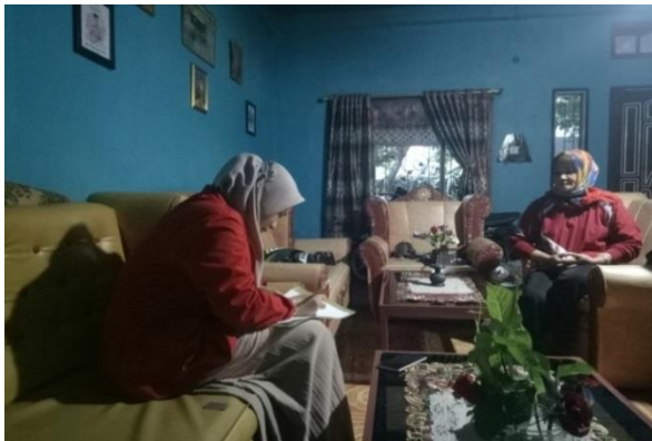
Informan Penyuluh Pertanian Desa Sukamaju