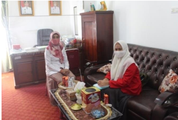
Informan Kepala Dinas Tanaman Pangan, Hortikultura dan Perkebunan Kabupaten Sinjai