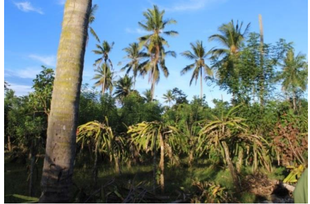
Kebun Buah Naga Desa Sukamaju