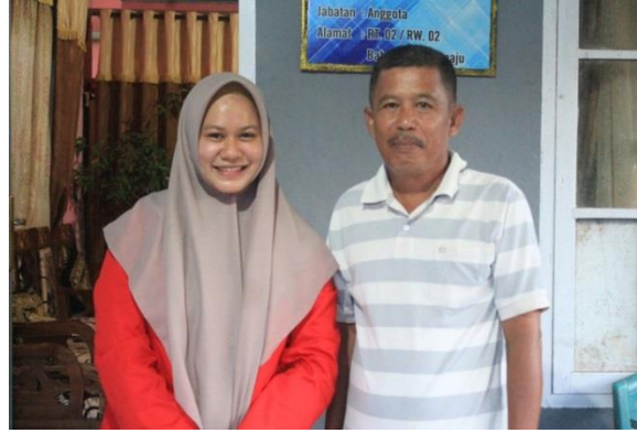
Informan Ketua Kelompok Tani