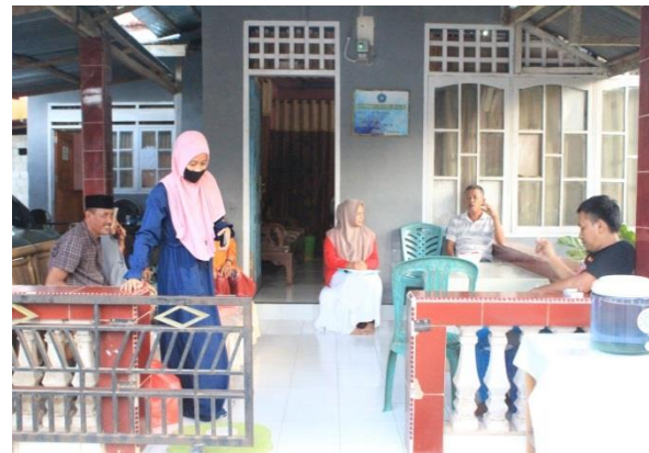
Rumah Kepala Desa Dan Beberapa Masyarakat Desa Sukamaju