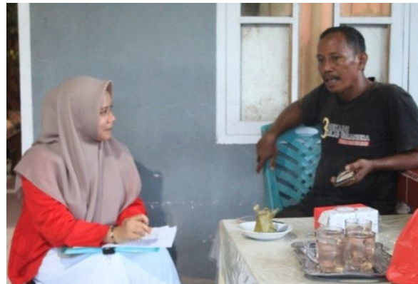
Informan Pedagang Pengumpul Buah Naga Desa Sukamaju