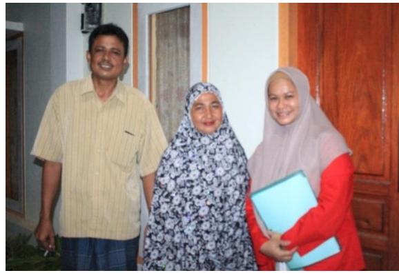
Informan Sekretaris Kelompok Tani