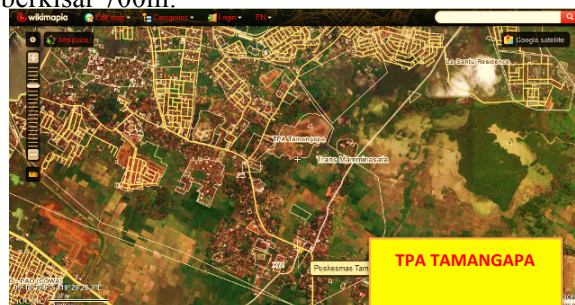
Gambar 2.2 Lokasi TPA Tamangapa dengan Puskesmas Tamanga

TPA Tamangapa bertempat di Kelurahan Tamangapa, Kecamatan Manggala, 17 km dari pusat Kota Makassar. TPA memiliki luas lahan sekitar 16,3 ha dan hanya 100% dari kapasitas keseluruhan TPA yang digunakan. TPA Tamangapa didirikan tahun 1993 dan dipertimbangkan sebagai satu-satunya TPA di Kota Makassar. Jarak TPA dengan Puskesmas Tamangapa sendiri berkisar 700m.