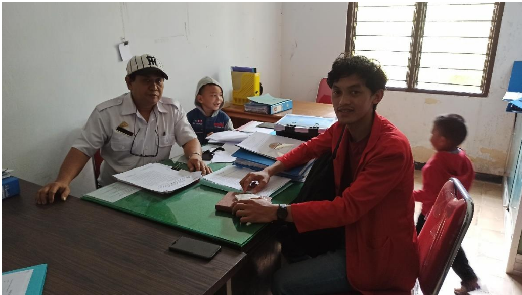
Wawancara pada Kepala Seksi Kajian Dampak Lingkungan Dinas Lingkungan Hidup Kabupaten Enrekang