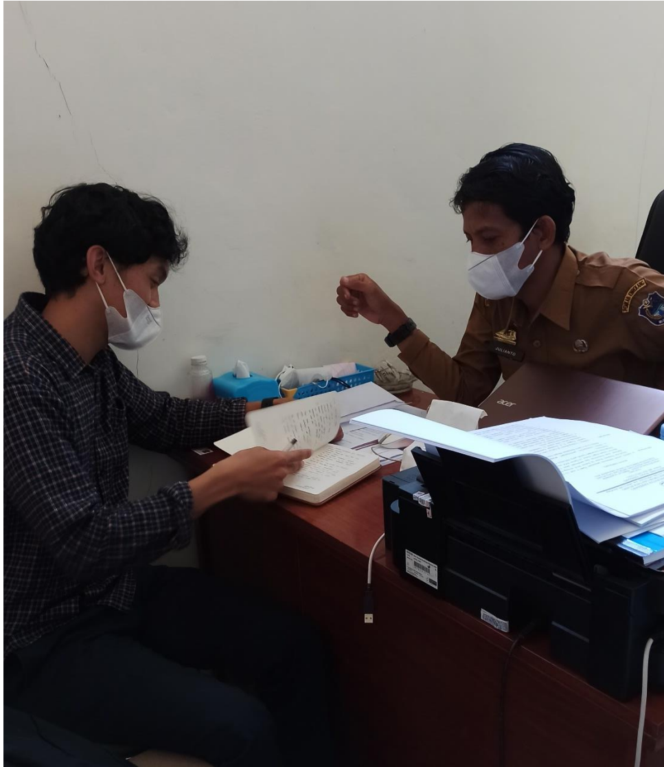
Wawancara pada Kepala Bidang Cipta Karya dan Tata Ruang Dinas Pekerjaan Umum dan Tata Ruang Kabupaten Enrekang