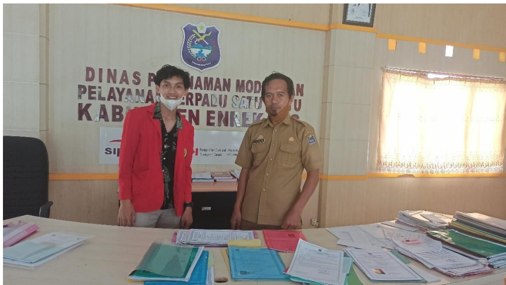
Wawancara pada Kepala Bidang Penyelenggaraan Pelayanan Perizinan Dinas Penanaman Modal dan Pelayanan Terpadu Satu Pintu Kabupaten Enrekang