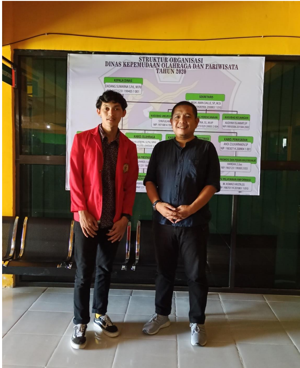
Wawancara pada Kepala Bidang Pengembangan Destinasi Dinas Pemuda, Olahraga, dan Pariwisata Kabupaten Enrekang