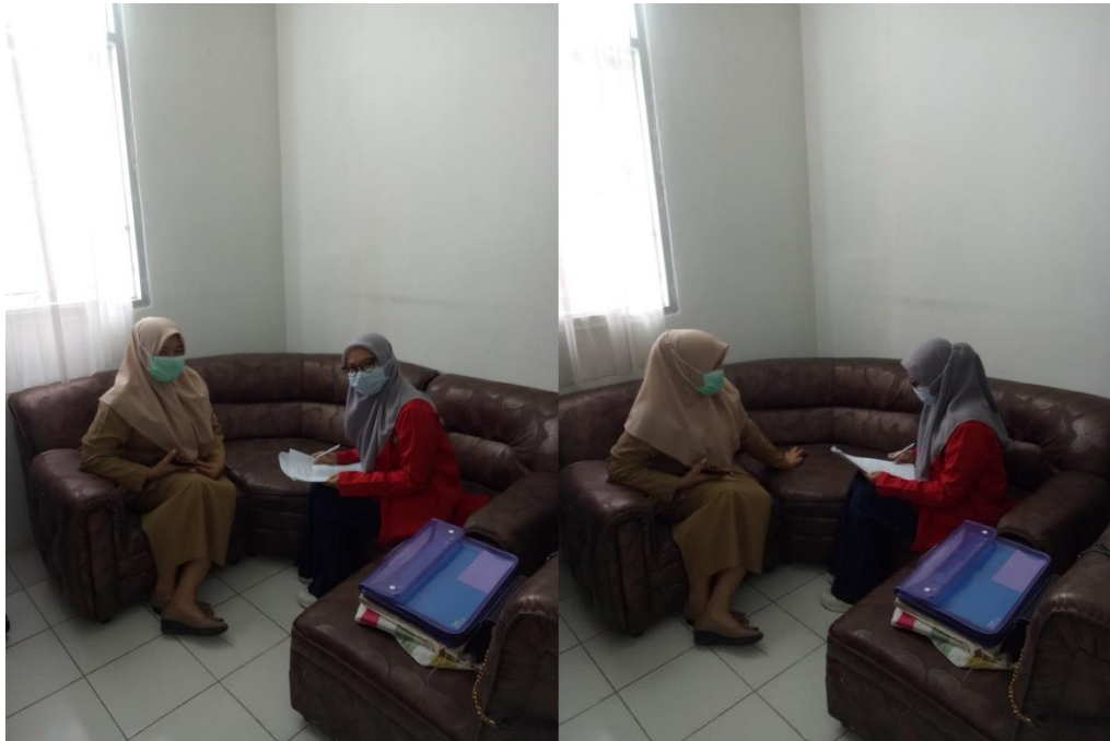
Wawancara dengan Kepala Bidang pelayanan Kesehatan di Dinas Kesehatan Kota Makassar, 25 januari 2021.