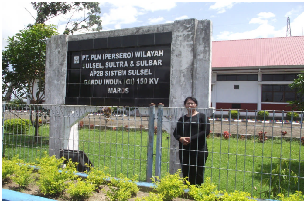
Gambar L6. 1 Foto Papan Nama gardu induk Maros 150 kV yang diambil tanggal 16 Maret 2012