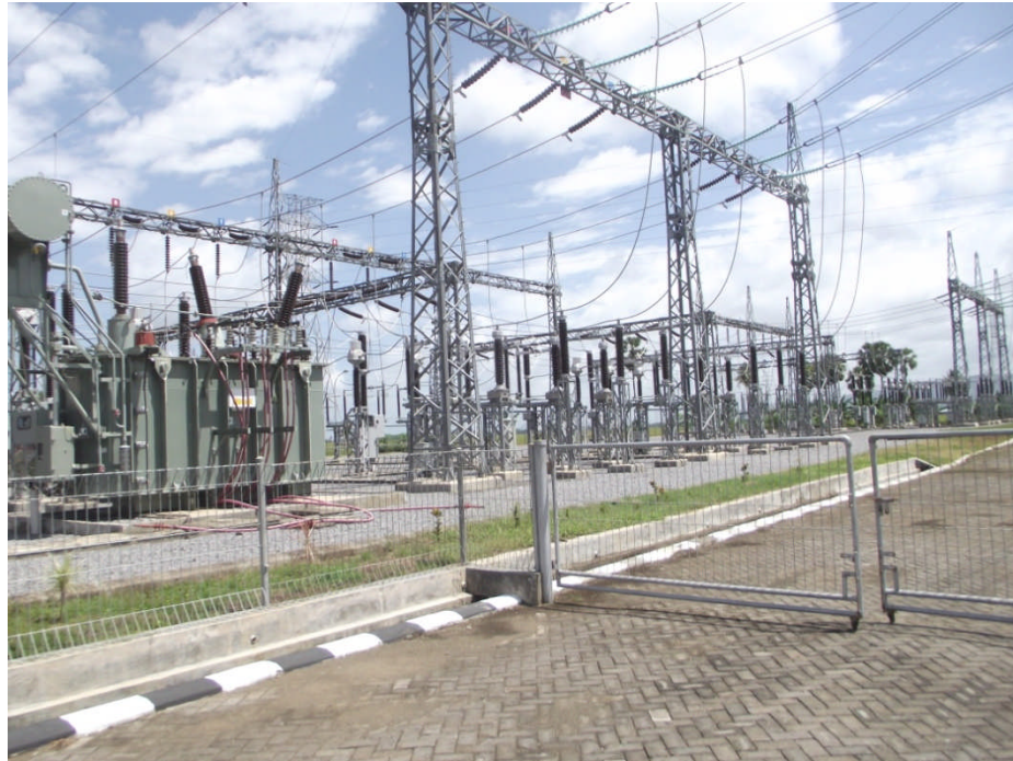
Gambar L6.2 Foto Peralatan Gardu Induk Maros yang diambil tanggal 16 Maret 2012