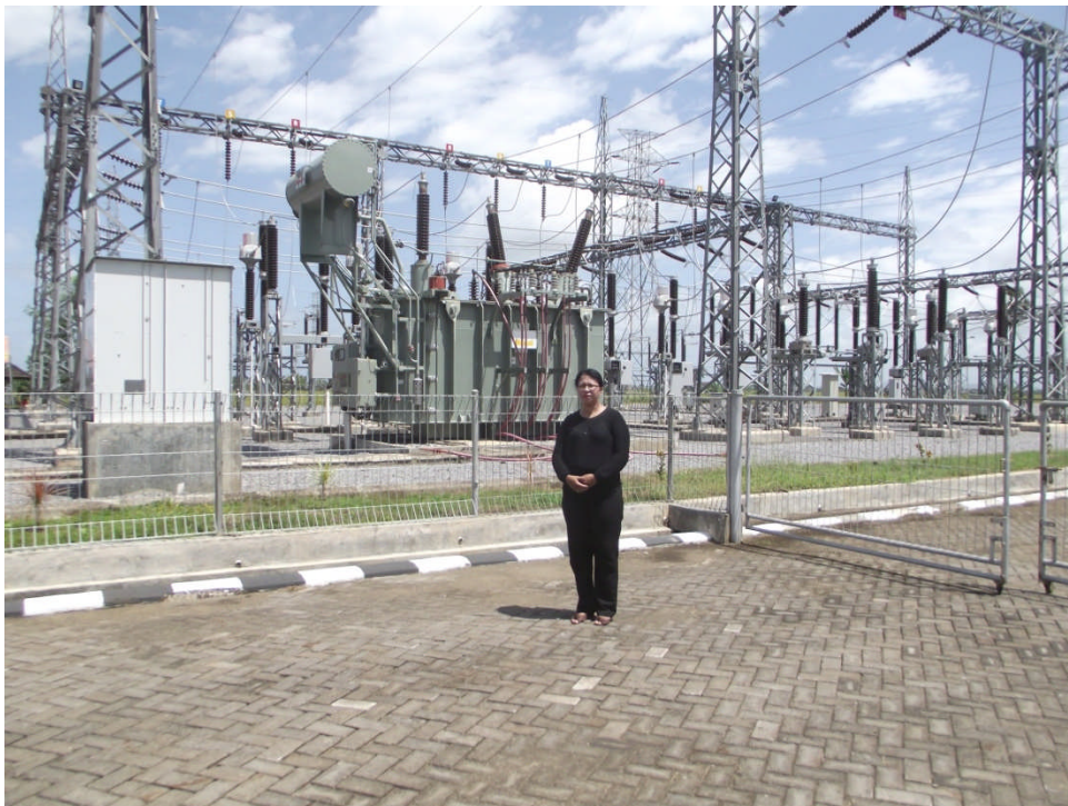
Gambar L6.3 Foto Gardu Induk Maros 150 kV yang di ambil tanggal 16 Maret 2012