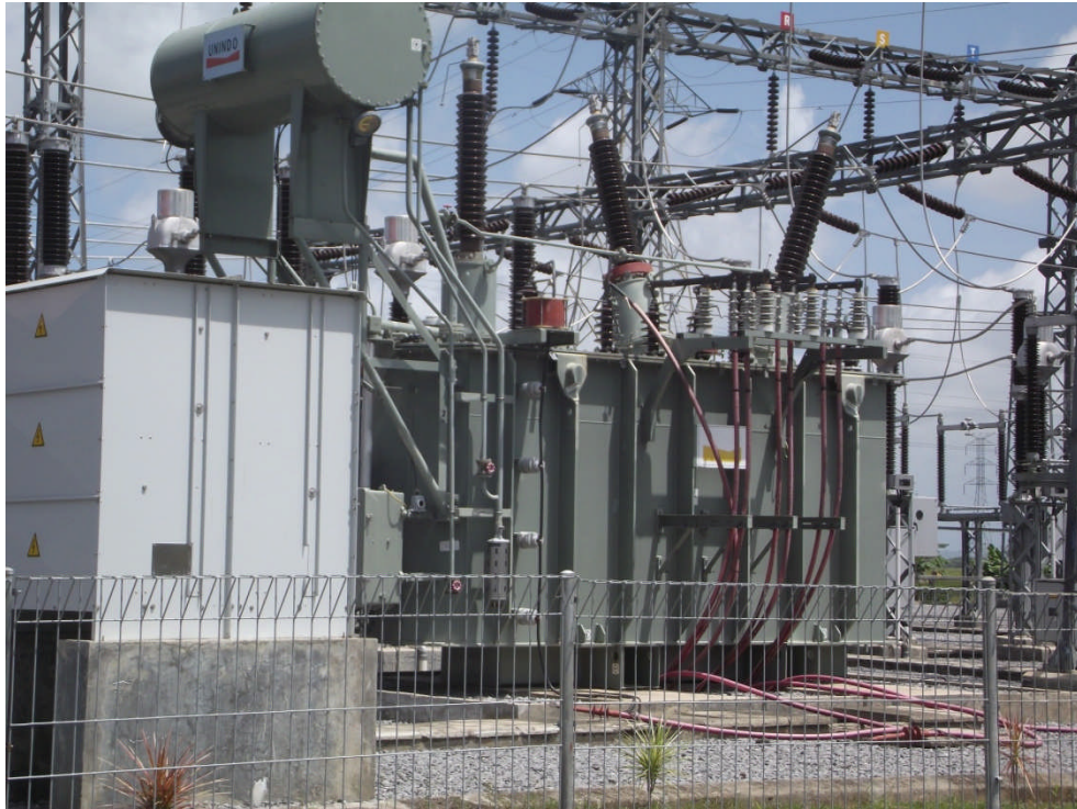
Gambar L6.4 Foto Tranformator Daya di Gardu Induk Maros yang diambil tanggal 16 Maret 2012