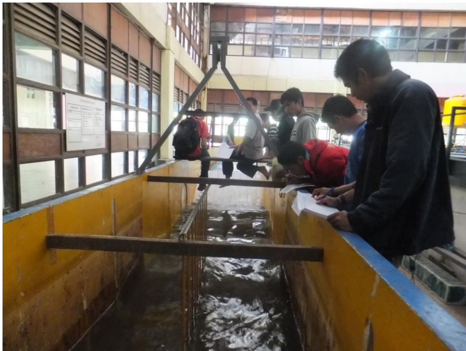
c. Pengamatan pada Model (M3SL1, M2SL2 & M2SL3)