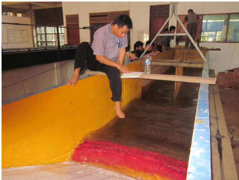
b. Pengamatan pada Model (M2SL1, M2SL2 & M2SL3)