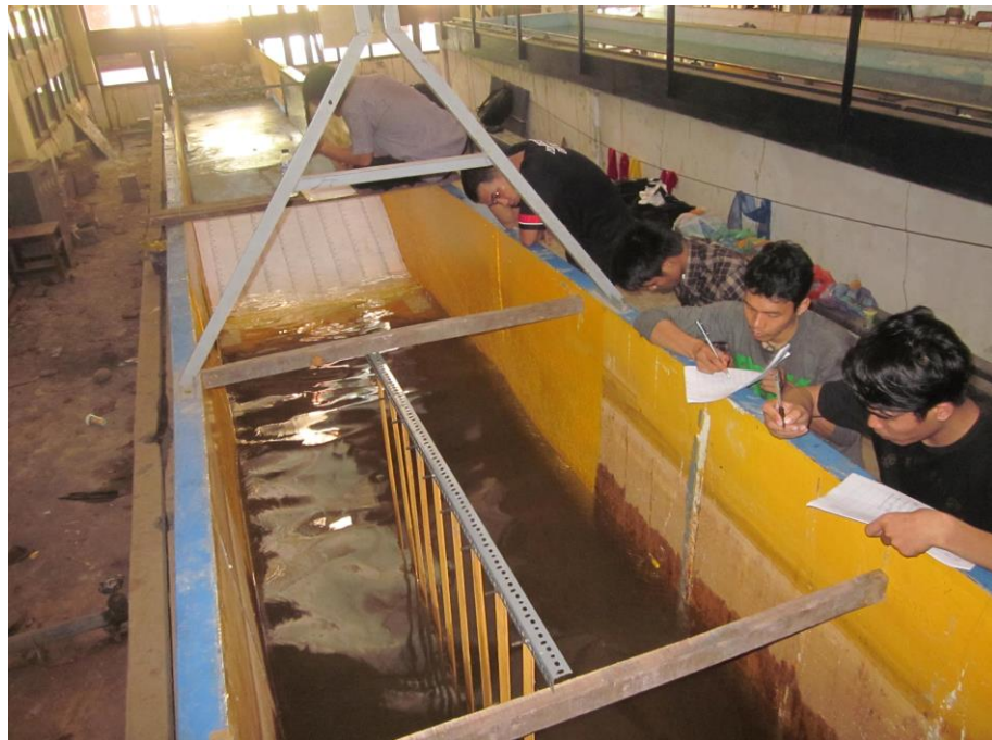
a. Pengamatan pada Model (M1SL1, M1SL2 & M1SL3)