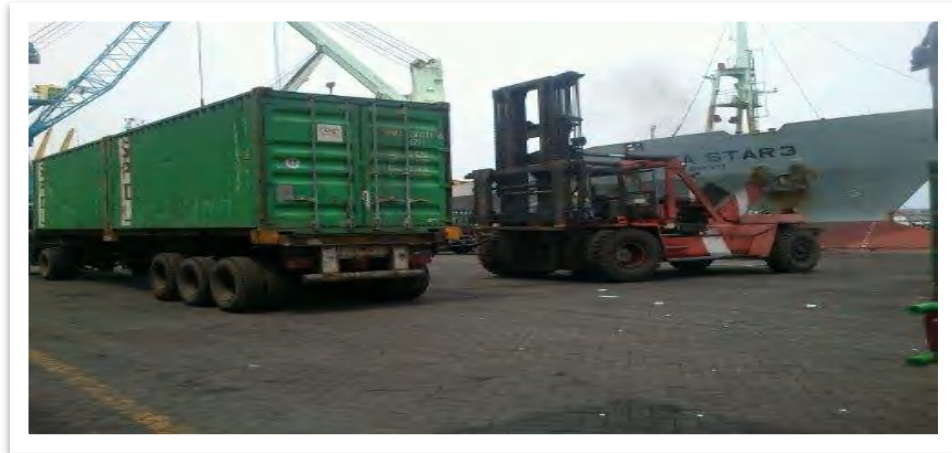
Gambar 2.4. Forklift