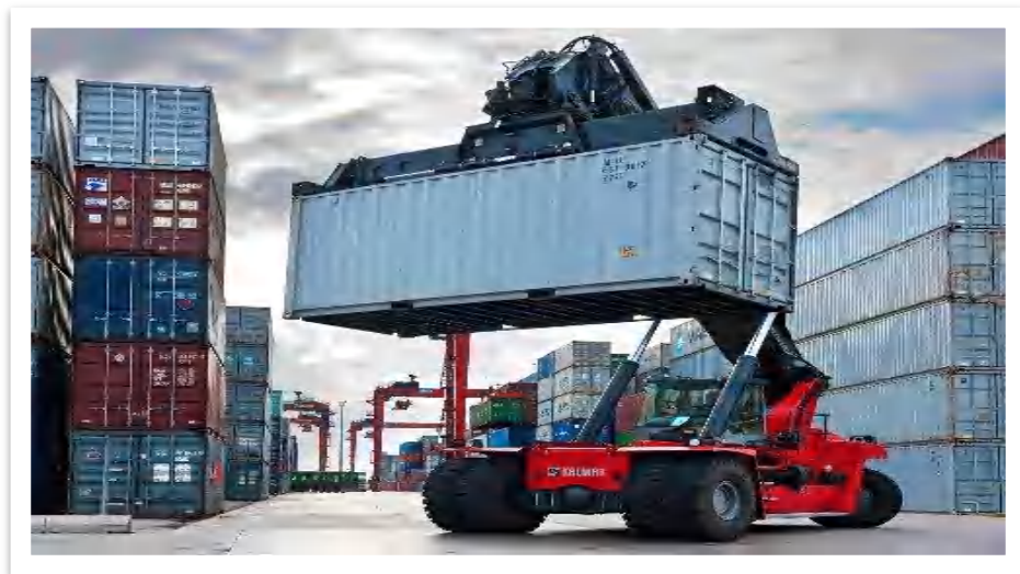
Gambar 2.2. Reach Stacker

Reach Stacker adalah kendaraan yang digunakan untuk menangani kontainer kargo intermodal di terminal kecil ataupun pelabuhan berukuran sedang. Alat Reach stacker mampu mengangkat kontainer jarak pendek dengan sangat cepat dan menumpuknya dalam berbagai baris, tergantung pada aksesnya.