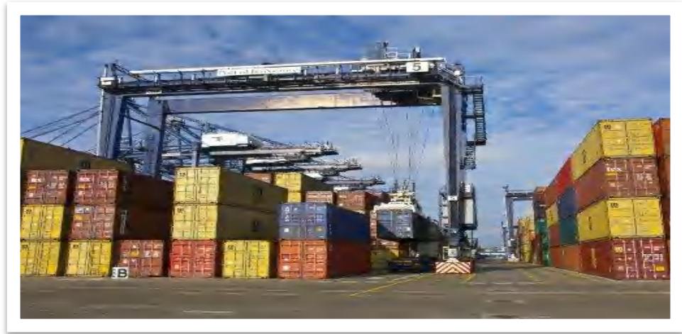
Gambar 2.3. Rubber Tyred Gantry