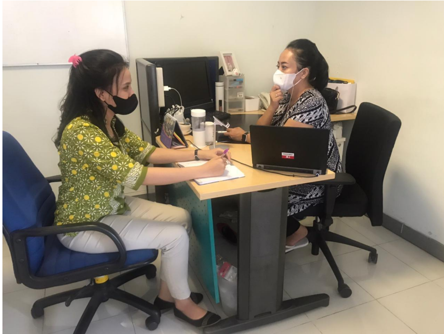
Wawancara bersama General Affair Analyst PT Garuda Indonesia Persero Tbk Makassar