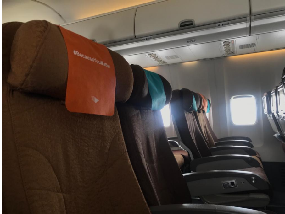
Seat Distancing di Pesawat Garuda Indonesia