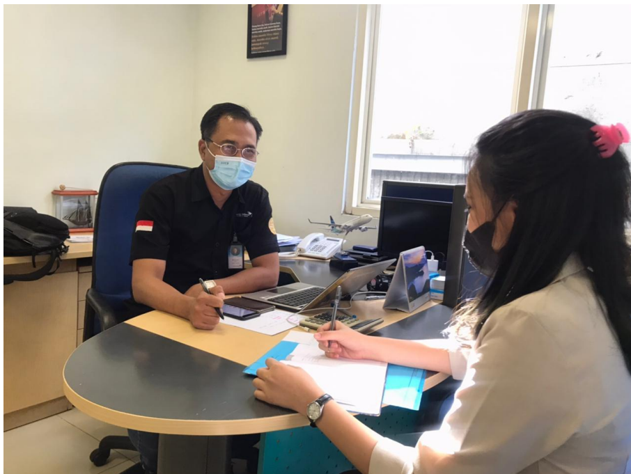
Wawancara bersama Sales & Marketing Manager PT Garuda Indonesia Persero Tbk Makassar