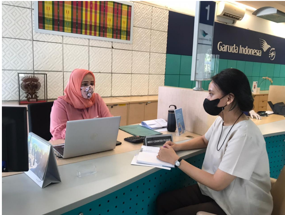
Wawancara bersama Customer Service PT Garuda Indonesia Persero Tbk Makassar