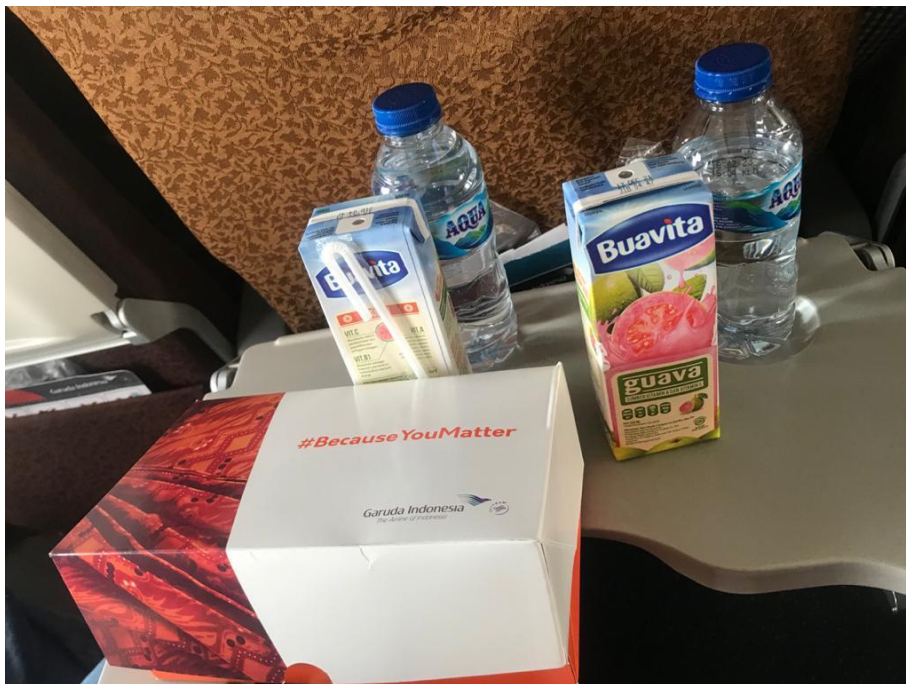
Fasilitas Personal Health Kit dan Snack di Pesawat Garuda Indonesia