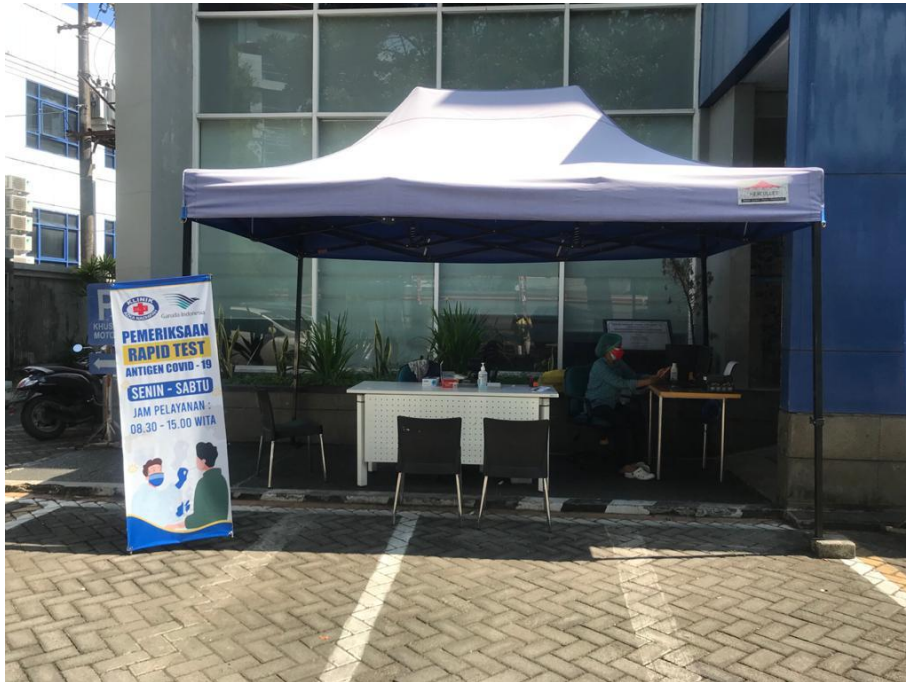
Layanan Rapid Test di Branch Office Garuda Indonesia Makassar