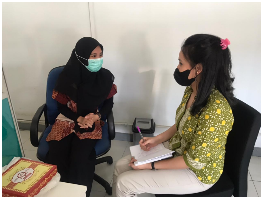
Wawancara bersama Admin Whatsapp Service PT Garuda Indonesia Persero Tbk Makassar