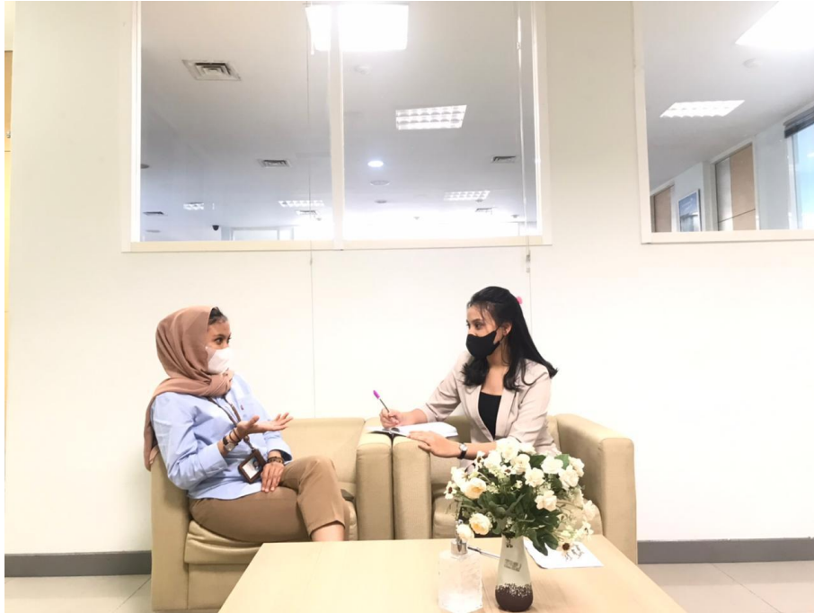
Wawancara bersama Staff Sales & Marketing PT Garuda Indonesia Persero Tbk Makassar