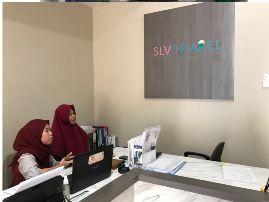
Kantor Slv Travel