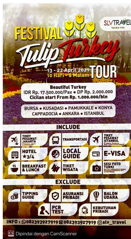
Flyer Promo Trip Slv Travel