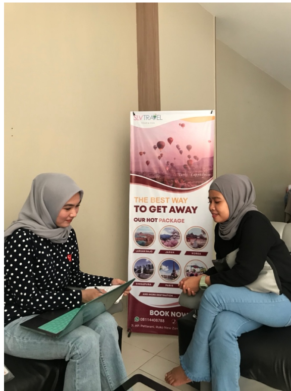
Proses wawancara bersama Admin/Consultant Tour Slv Travel