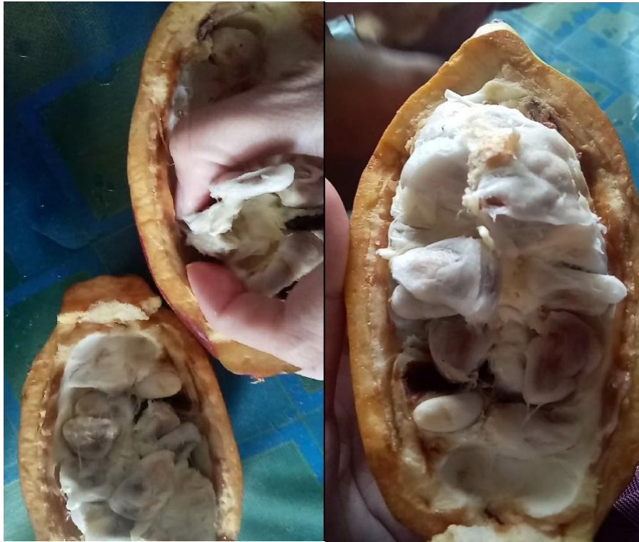
Lampiran 38. Gambar Buah kakao yang terkena penyakit PBK