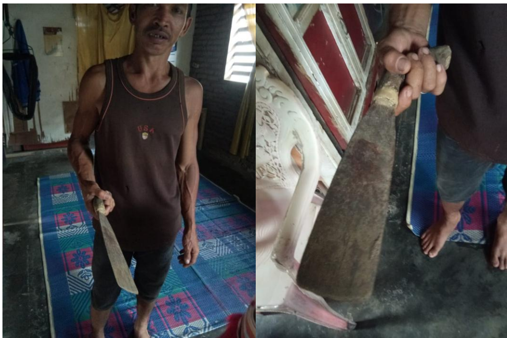
Lampiran 35. Gambar Sodo' yaitu alat tradisional yang dipakai petani kakao untuk memecah buah kakao