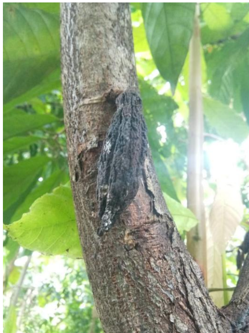
Lampiran 39. Gambar Buah Kakao yang terkena penyakit sehingga kering dan menghitam