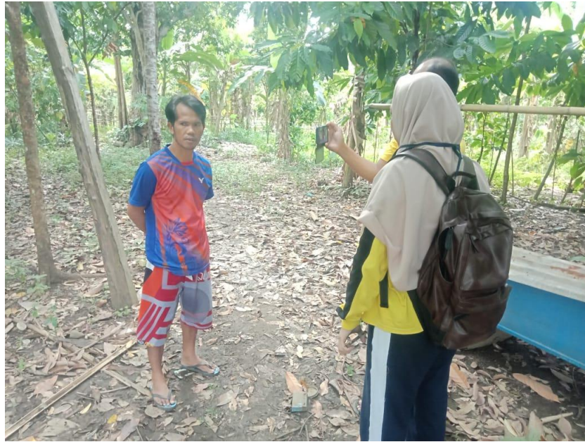
Lampiran 34. Gambar wawancara dengan petani kakao lingkungan Ahuni, Kel. Bebanga, Kec. Kalukku, Kab. Mamuju