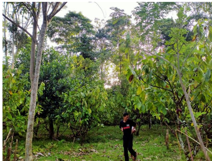
Lampiran 37. Gambar Kebun Kakao petani di Lingkungan Ampallas, Kel. Bebanga, Kec. Kalukku, Kab. Mamuju