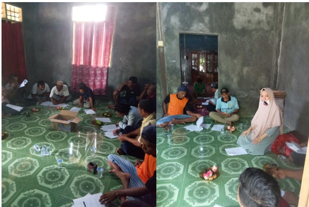
Lampiran 31. Gambar wawancara dan pendampingan pengisian kuisioner penelitian kepada para petani kakao di Lingkungan Ahuni Pili', Kel. Bebanga, Kec. Kalukku