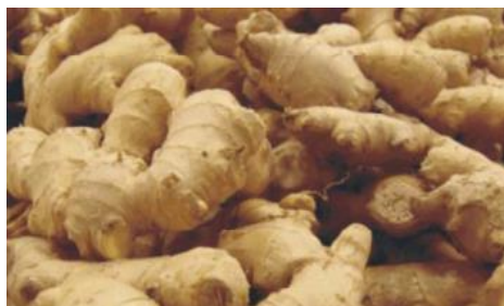
Gambar 1. Jahe ( Zingiber officinale ) (Gull et al., 2012)

Kingdom : Plantae Subkingdom : Tracheobionta Divisi : Spermatophyta Class : Monocotyledoneae Ordo : Zingiberales Famili : Zingiberaceae Genus : Zingiber Spesies : Zingiber officinale Rosc.