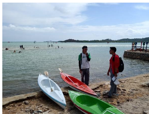
Fasilitas perahu sewa