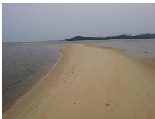
Pasir pantai setokok