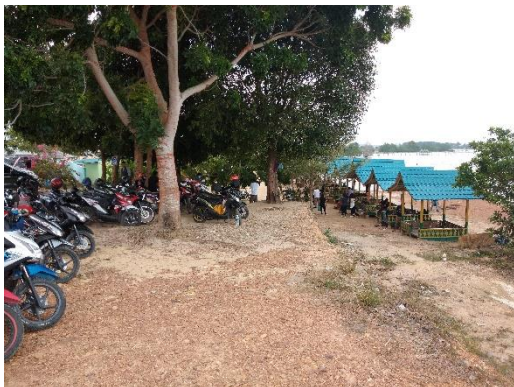
Lahan parkir untuk pengunjung