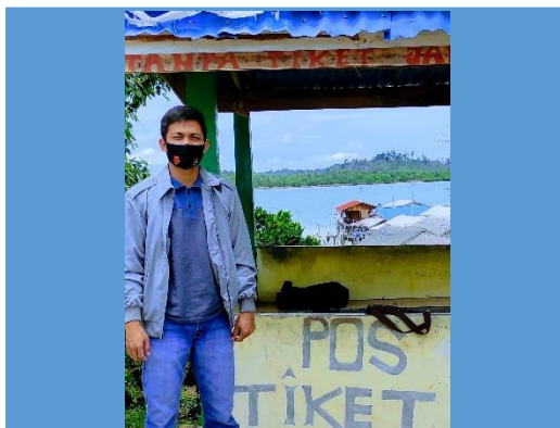
pos pembayaran Tiket