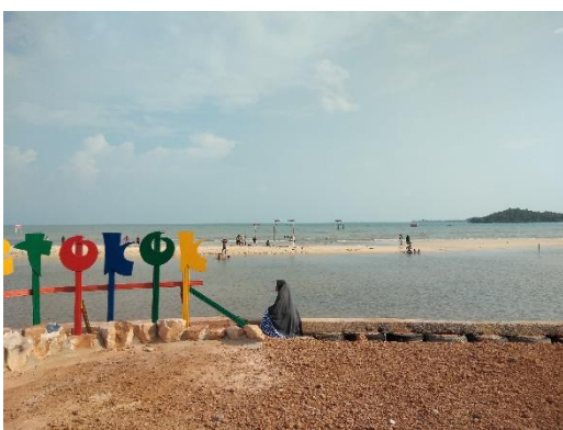
Spot foto Pantai Setokok