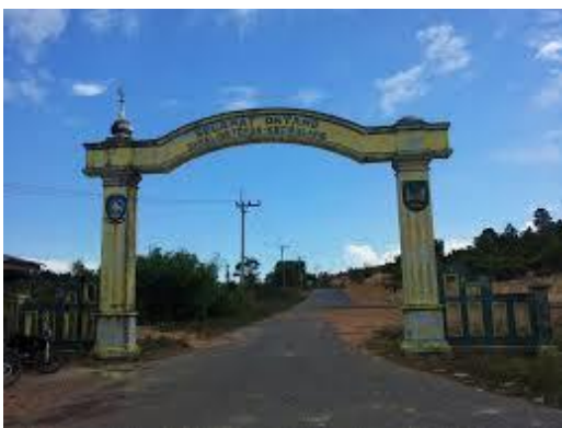
Gapura Masuk kelurahan Setokok