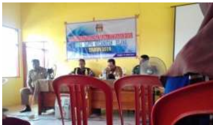
Kegiatan Musrenbang Tahun 2019 Desa Sappa Kecamatan Belawa Kabupaten Wajo