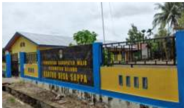
Kantor Desa Sappa Kecamatan Belawa Kabupaten Wajo