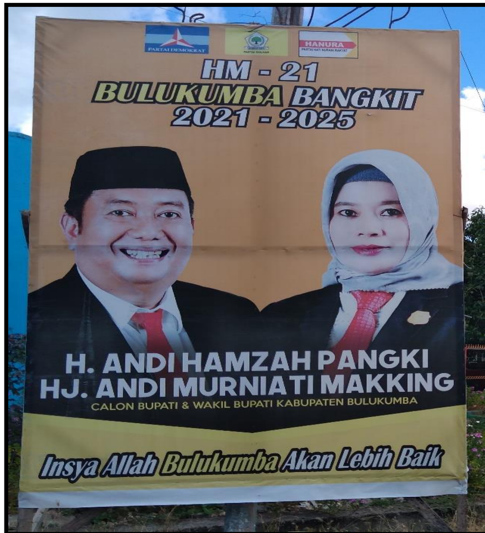
Gambar baliho pasangan calon no. 1 diperoleh 29/10/2020 di Kecamatan Ujung Bulu, Kabupaten Bulukumba