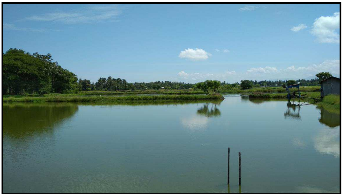
Kondisi Tambak di DAS Lisu