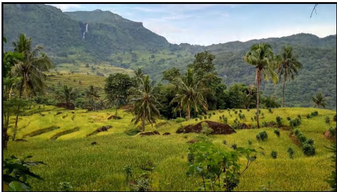
Kondisi Sawah di DAS Lisu