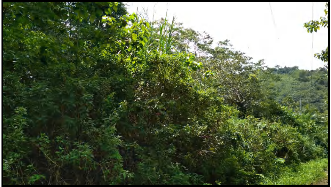
Kondisi Semak Belukar di DAS Lisu