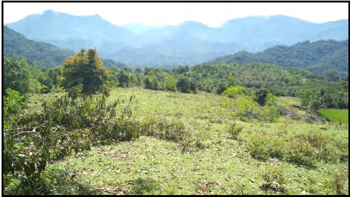
Kondisi Padang Rumput di DAS Lisu