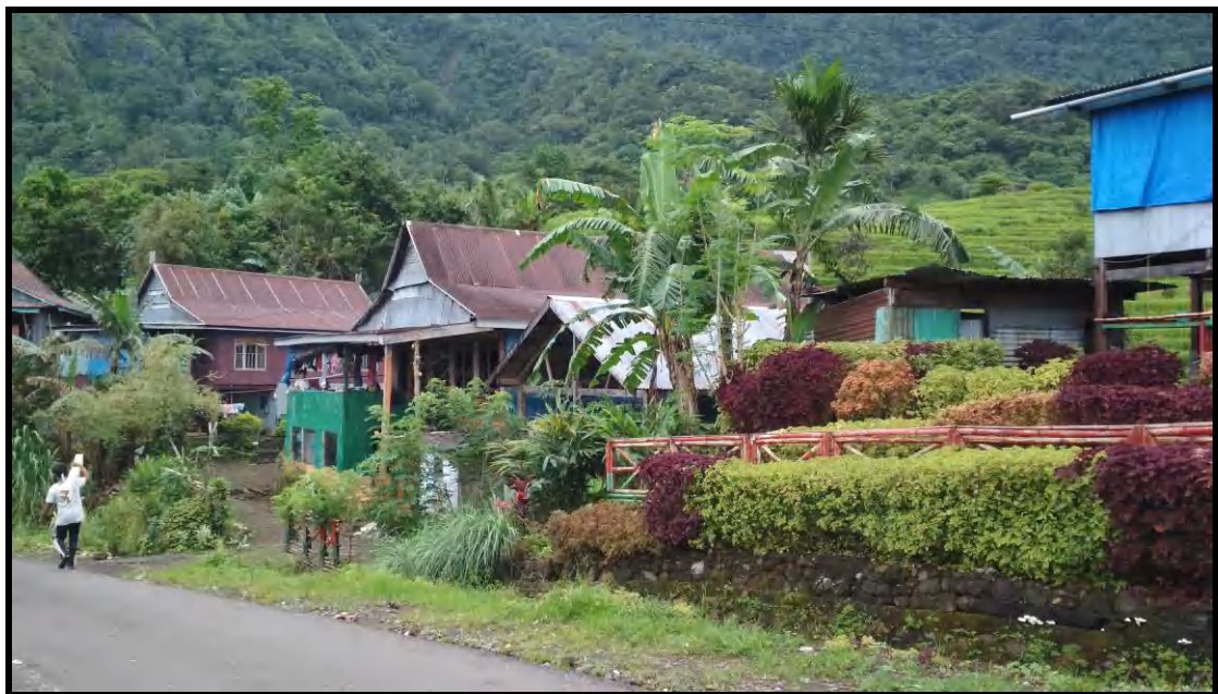
Kondisi Pemukiman di DAS Lisu