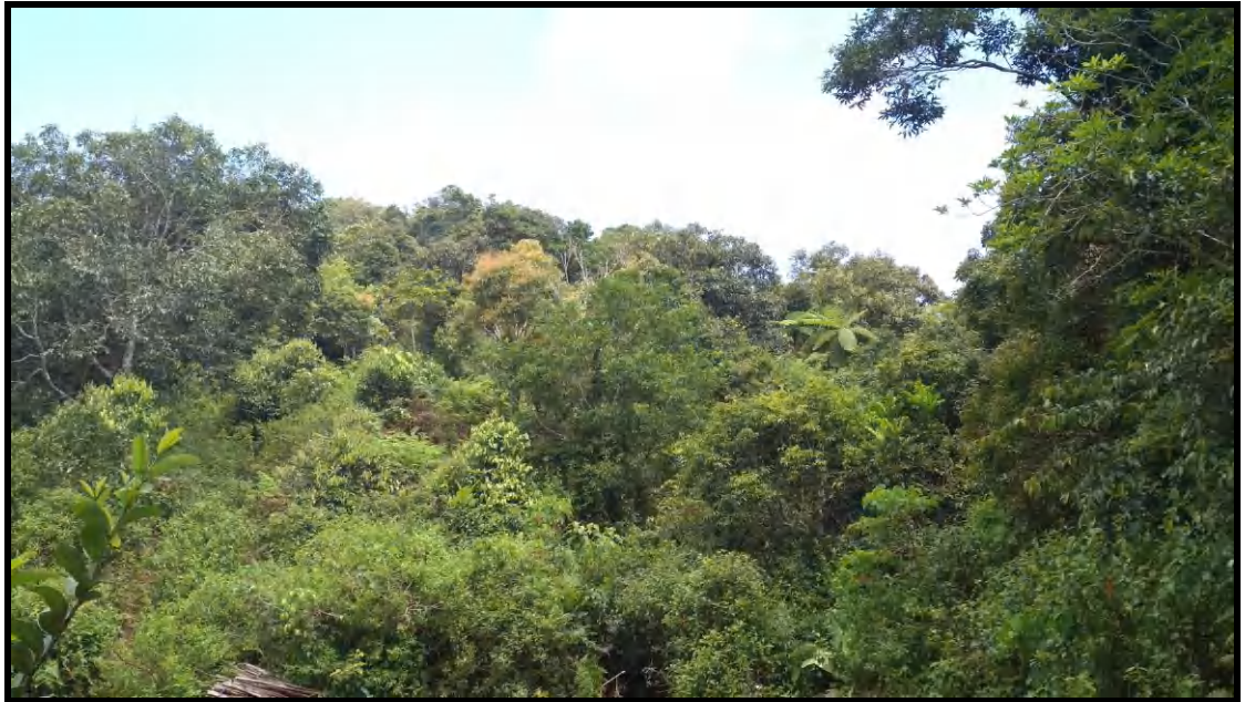
Kondisi Hutan Lahan Kering Sekunder di DAS Lisu