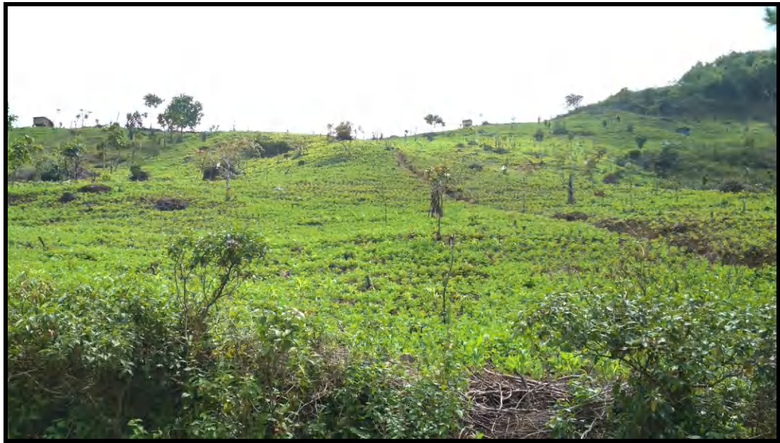
Kondisi Pertanian Lahan Kering Campur Semak di DAS Lisu