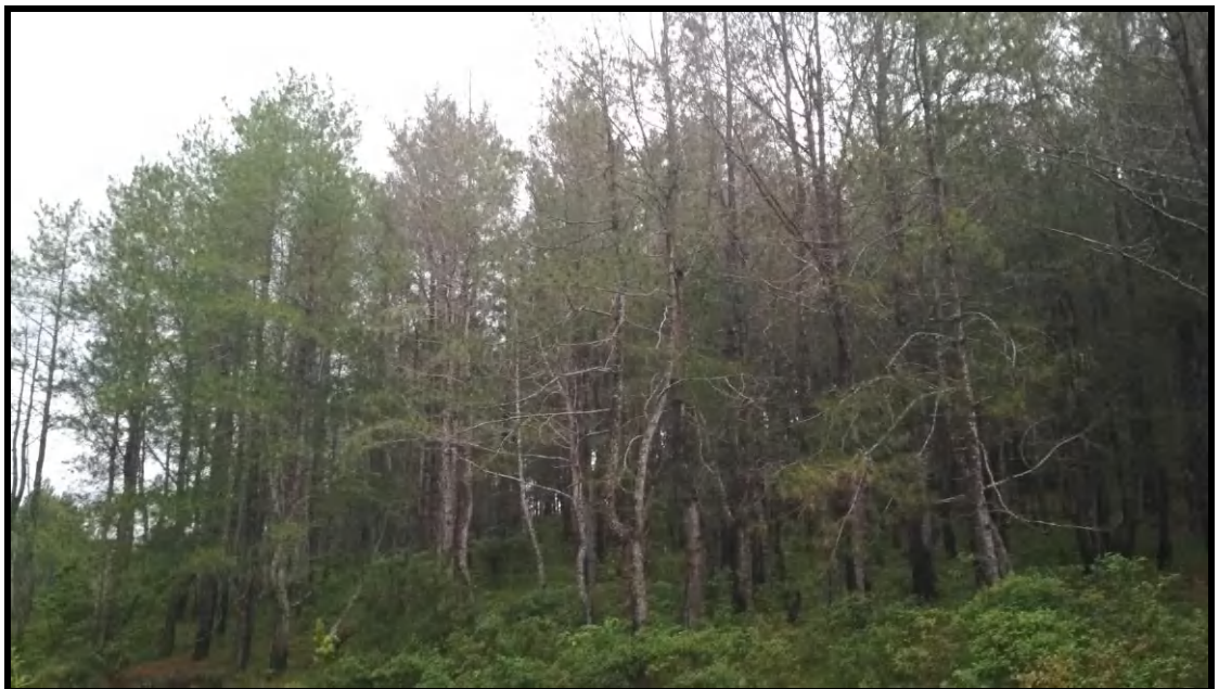
Kondisi Hutan Tanaman di DAS Lisu