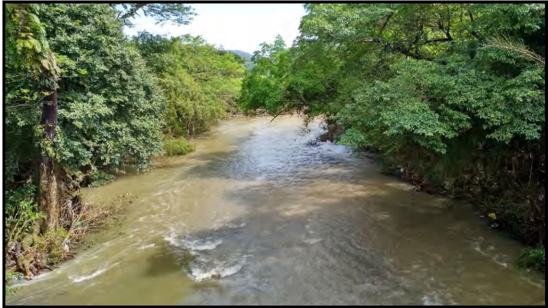
Kondisi Tubuh Air di DAS Lisu