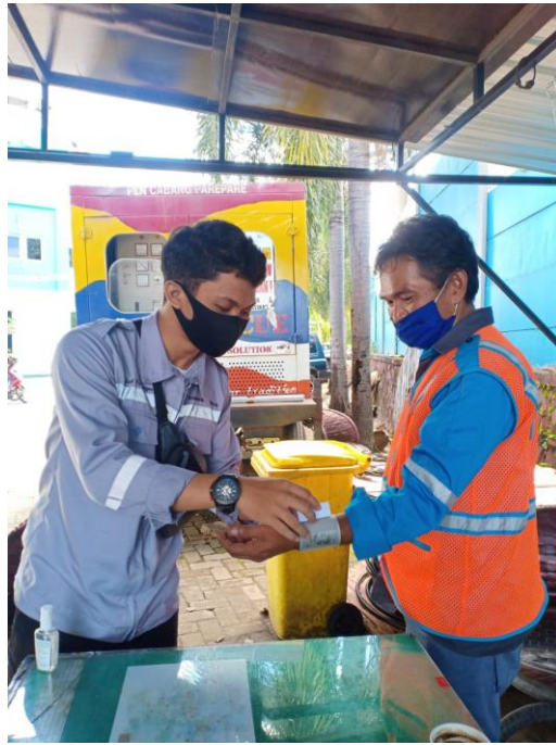
Gambar 1. Melakukan pengukuran tentang Beban kerja dan wawancara mengenai Kelelahan Kerja dan MSDs dengan responden selaku pekerja PT. PLN (Persero) Area Pare-pare