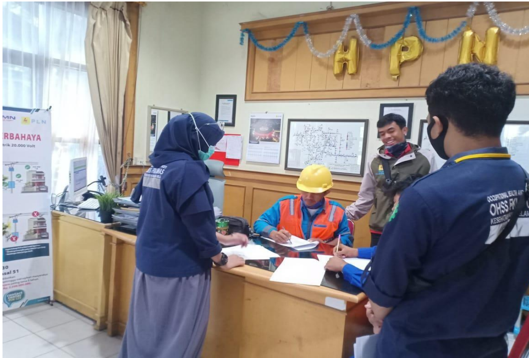
Gambar 1. Responden selaku pekerja pada PT. PLN (Persero) Area Pare-pare mengisi kuesioner MSDs dan kelelahan kerja