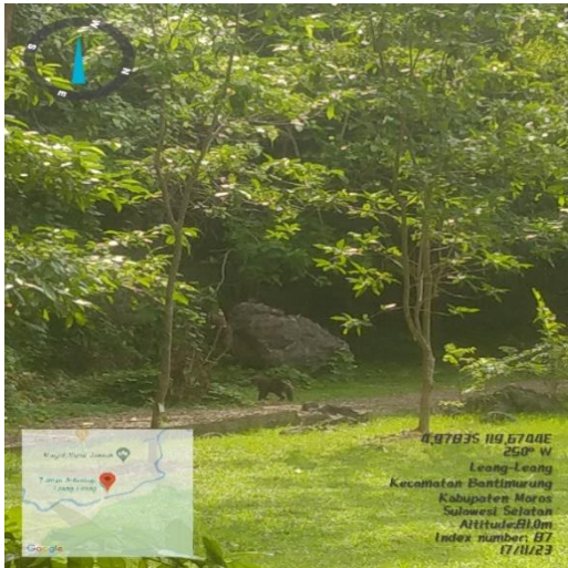
Monyet Ekor Pendek ( Macaca maura )