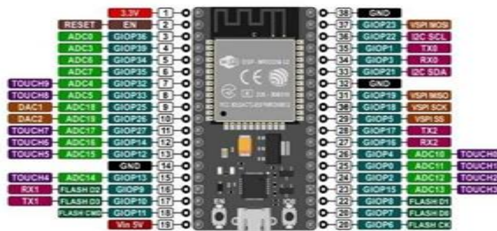
Gambar 1. ESP32 pinout parts

ESP32-WROOM-32 ini merupakan sebuah mini mikrokontroler yang punya fitur Bluetooth LE dan WiFi. Perangkat ini punya beberapa fitur seperti punya lebih banyak pin analog, Capacitive touch sensors , SD card interface , Hall sensors , Ethernet , UART , high-speed SPI , I2C dan I2S . Dibandingkan dengan ESP8266 (Hudhajanto et al. , 2022).