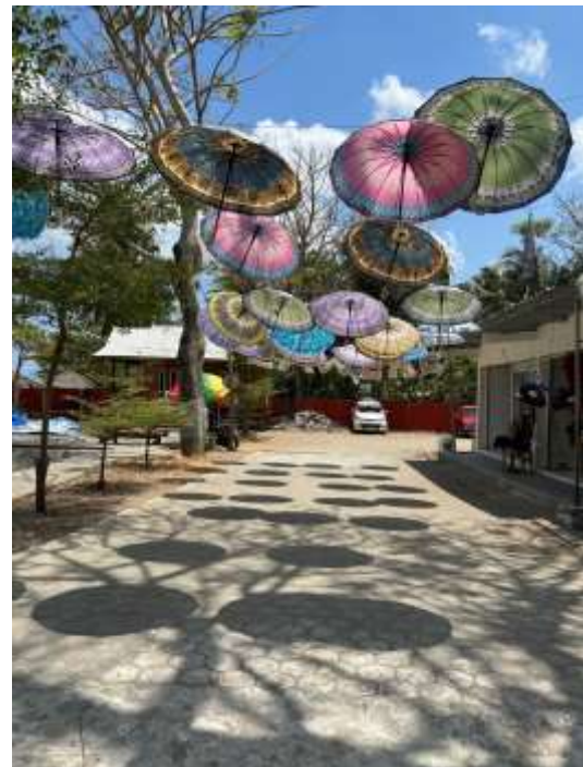
Spot Foto Payung