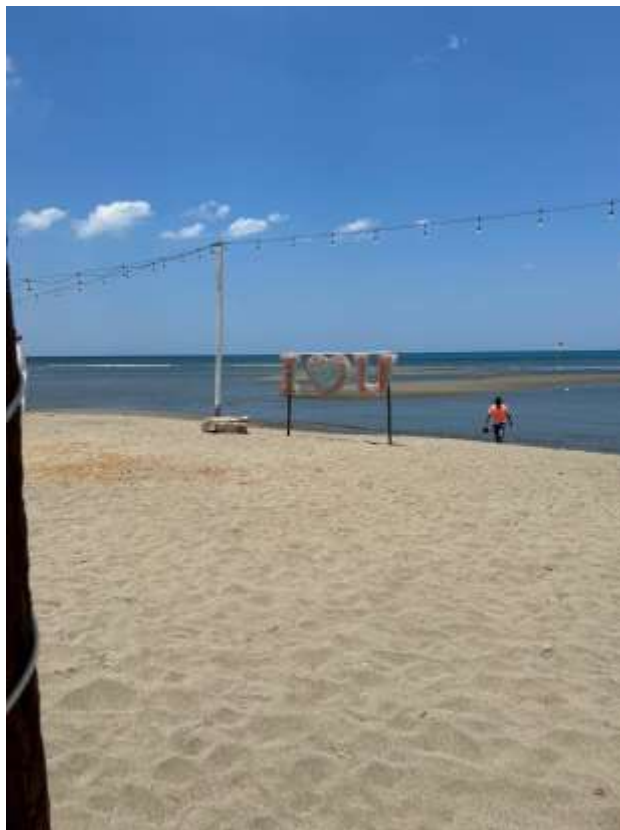
Spot Foto Pantai Lawere