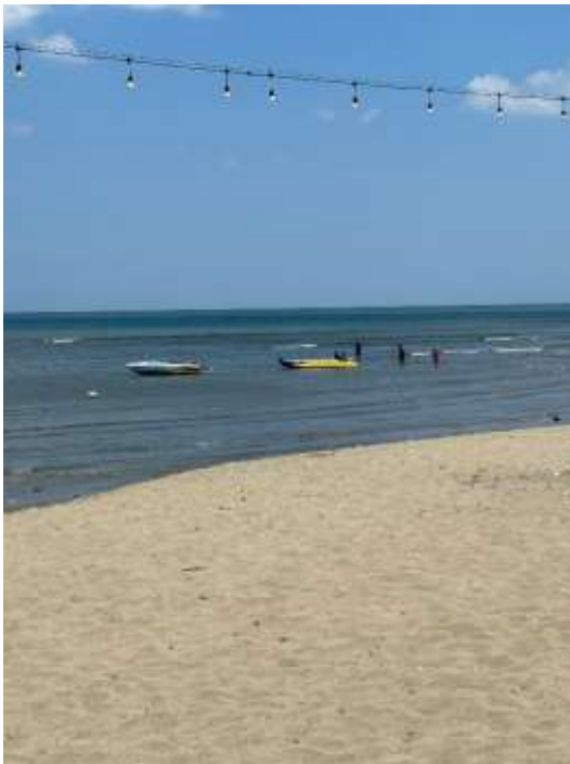
Wahana air Pantai Lawere