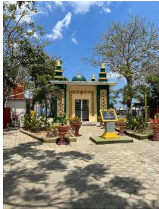
Musholla Pantai Lawere