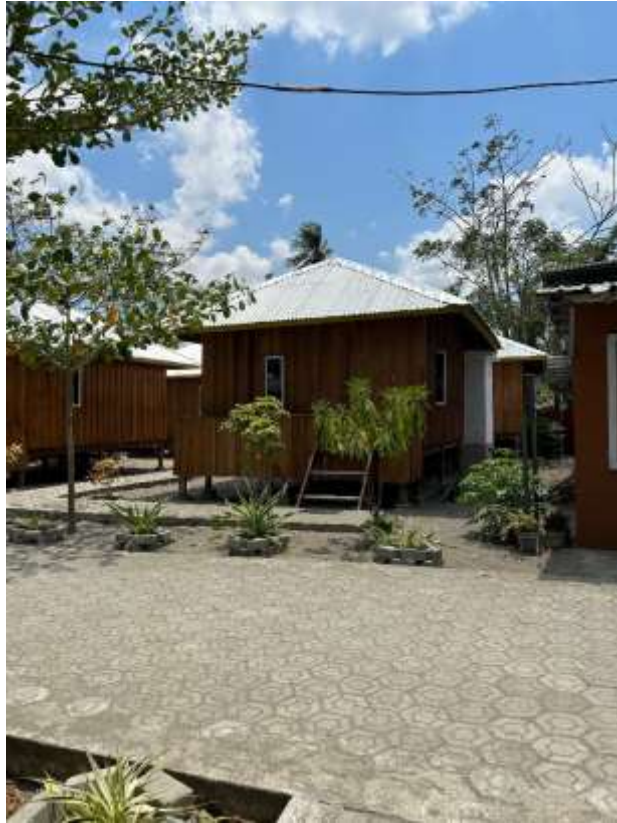
Penginapan Pantai Lawere