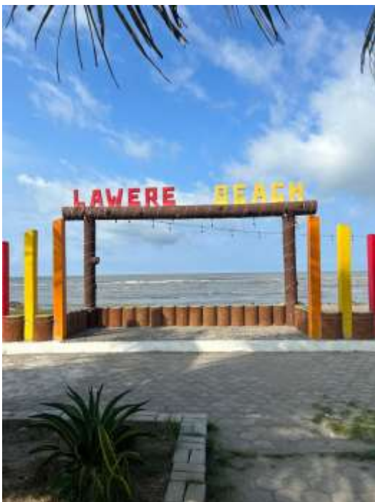
Spot Foto Lawere Beach