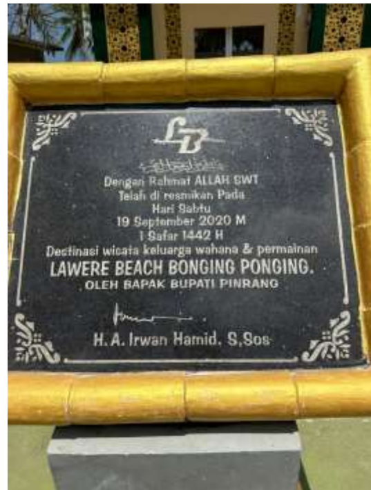
Batu Peresmian Pantai Lawere