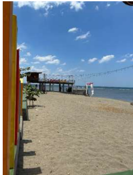
Dermaga Pantai Lawere