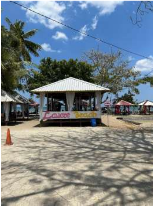
Gazebo Pantai Lawere