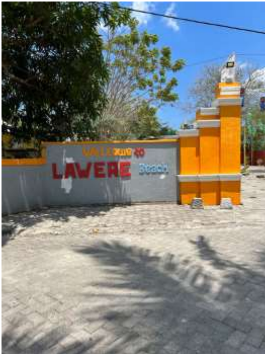
Pintu Masuk Pantai Lawere