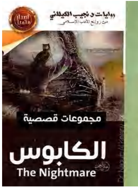
غطاء قصة القصيرة لنجيب الكيلاني 2 الملاحق