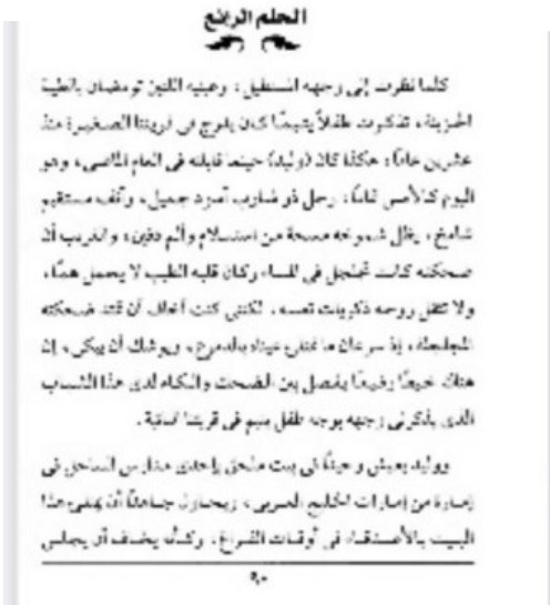
املاحق7 قصة قصيرة بعنوان الحلم الرابع