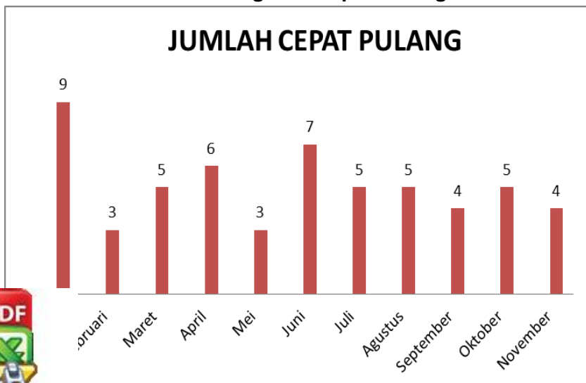
Gambar 1.2 Jumlah Pegawai Cepat Pulang Tahun 2023

Berdasarkan bagan diatas diketahui bahwa pada bulan Agustus jumlah pegawai yang terlambat masuk relatif rendah yaitu 37% dan pada bulan Februari dan Maret pegawai yang terlambat masuk relatif tinggi mencapai 86%.