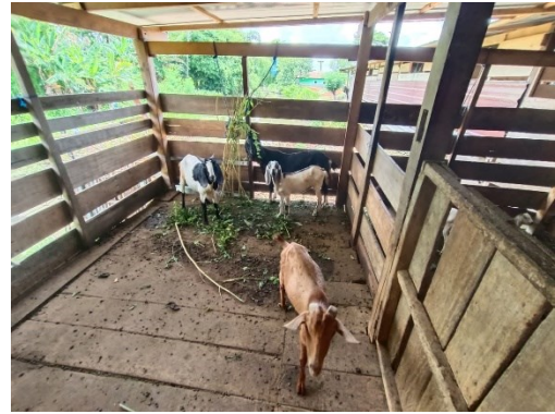
Ket. Tampak dalam kandang