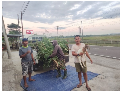
Ket. Tenaga kerja pemeliharaan