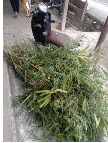
Ket. Hijauan untuk kambing