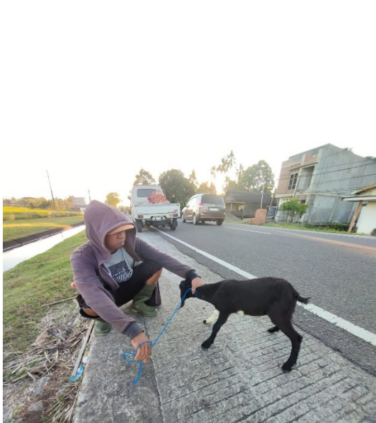
Ket. Kambing siap diangkut konsumen