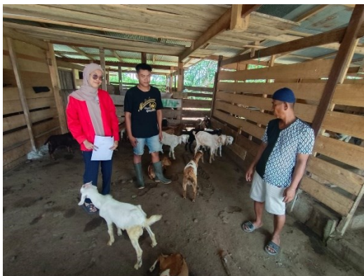
Ket. Foto dengan pemeliharaan kambing