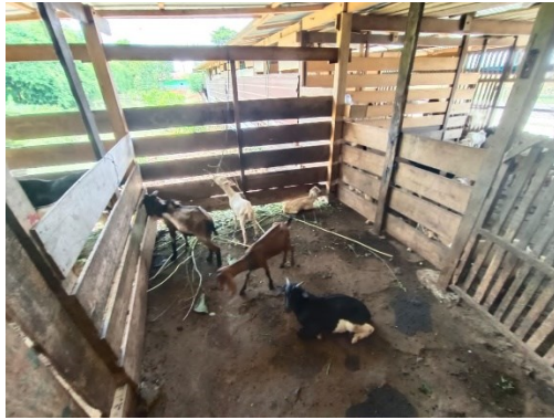
Ket. Tampak dalam kandang