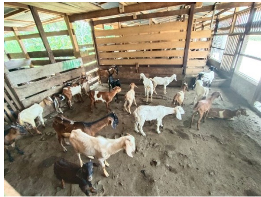
Ket. Kambing saat dikandangkan