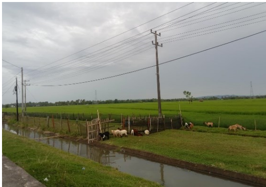
Ket. Tampak lahan penggembalaan