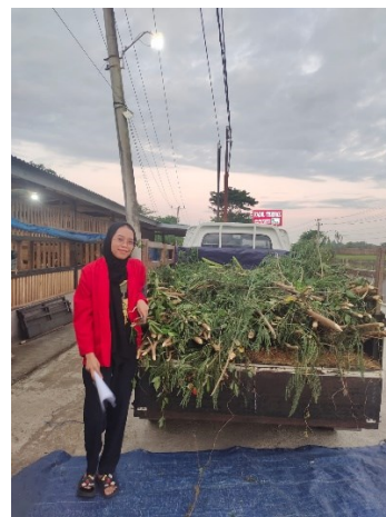
Ket. Foto dengan Hijauan