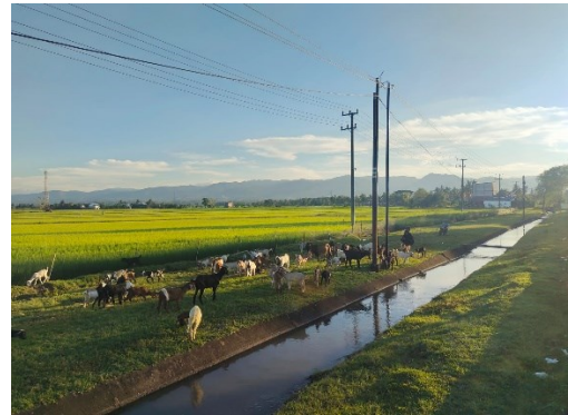
Ket. Tampak lahan penggembalaan