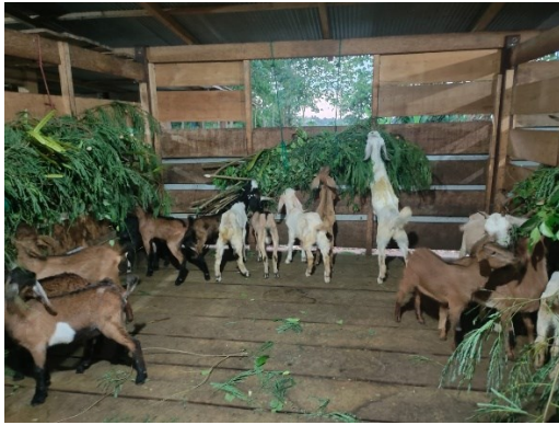
Ket. Kambing saat diberi hijauan