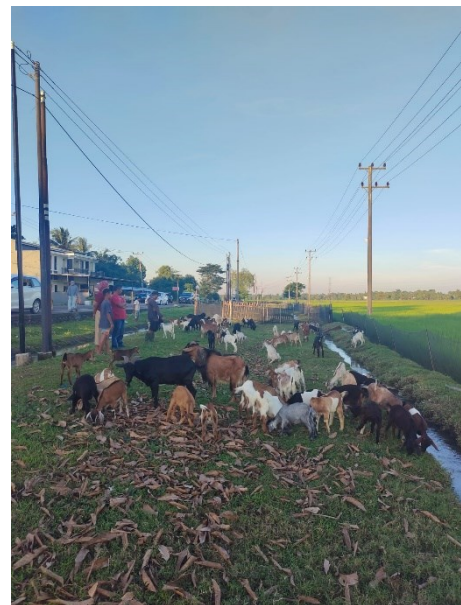
Ket. Pembeli melihat kambing