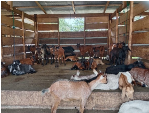
Ket. Tampak kandang panggung