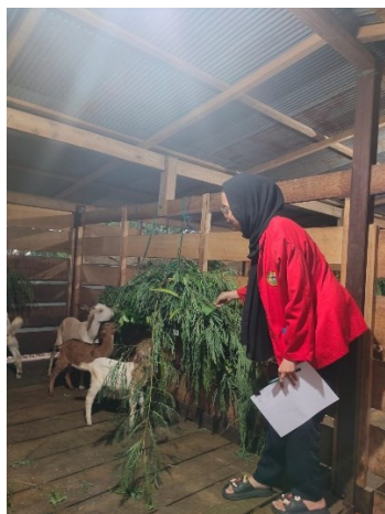
Ket. Kambing saat diberikan hijauan