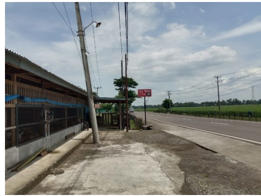
Ket. Jarak kandang dan jalan raya