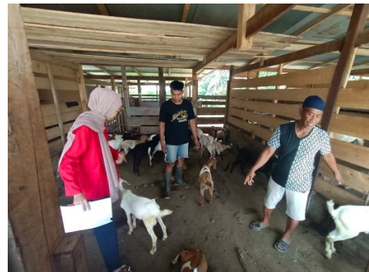
Ket. Tampak dalam kandang