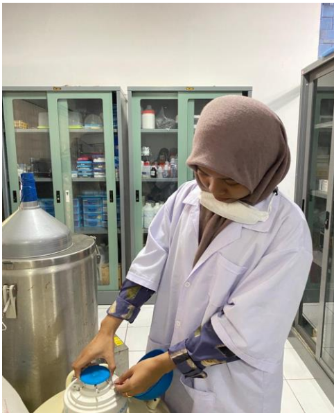
Ket: Penyimpanan Straw dalam Kontainer