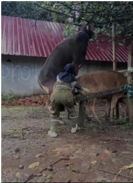
Ket: Penampungan semen