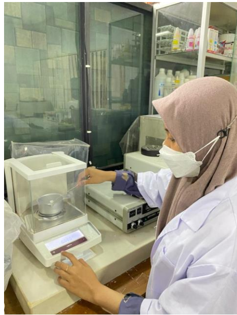
Ket: Penimbangan Mikronutrisi