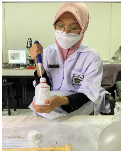
Ket: Pembuatan Pengencer Andromed