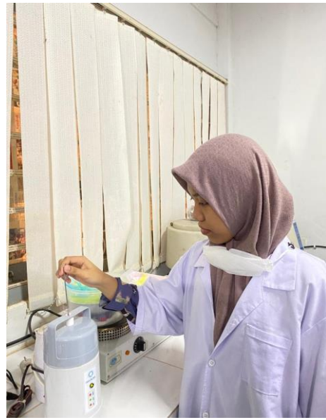
Ket: Thawing Straw