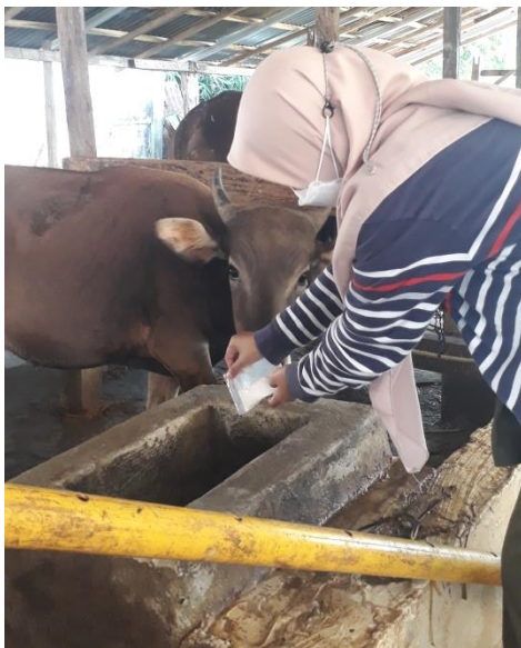
Ket: Pemberian Mikronutrisi