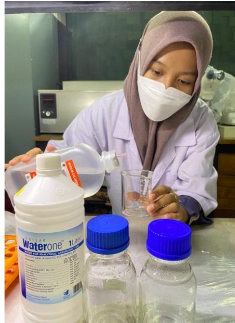
Ket: Pembuatan Larutan Host