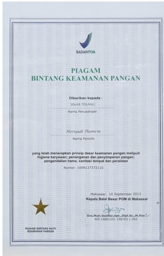
Piagam Keamanan Pangan dari BPOM