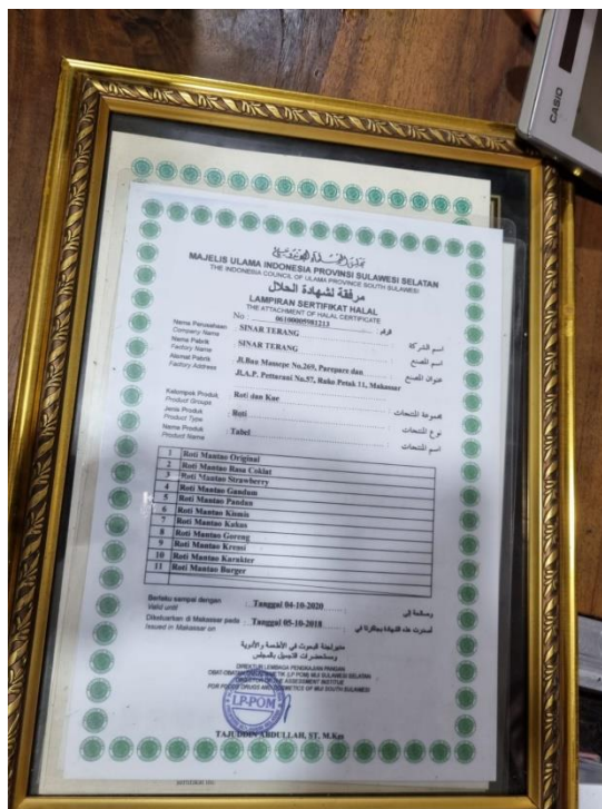
Sertifikat Halal Roti Mantao Pare