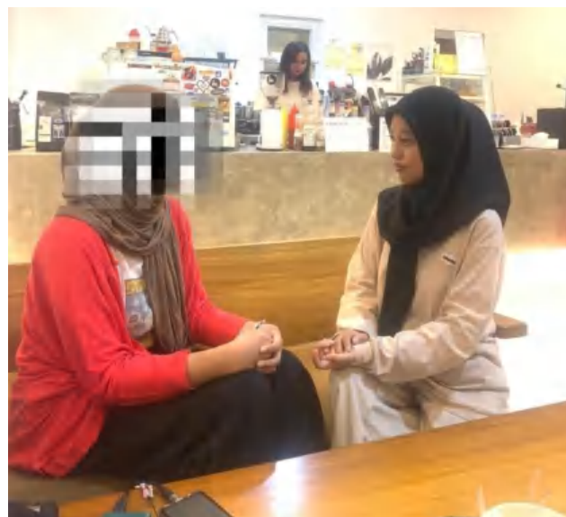
16 November 2023, Pukul 16.45 WITA