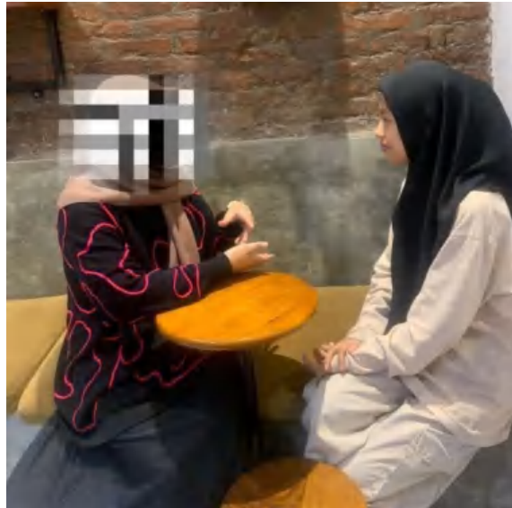
16 November 2023, Pukul 14.00 WITA