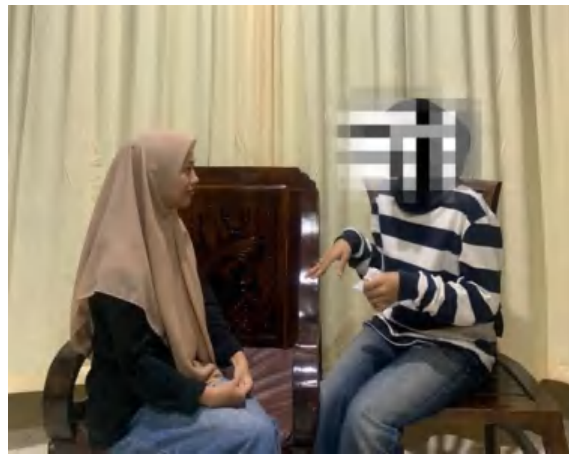
23 November 2023, Pukul 17. 23 WITA