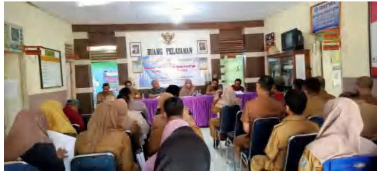
Foto dan Wawancara oleh Anggota DPRD Pangkep Dapil Minasa Te'ne oleh Ir. Alfian Muis & Lurah Minasa Te'ne