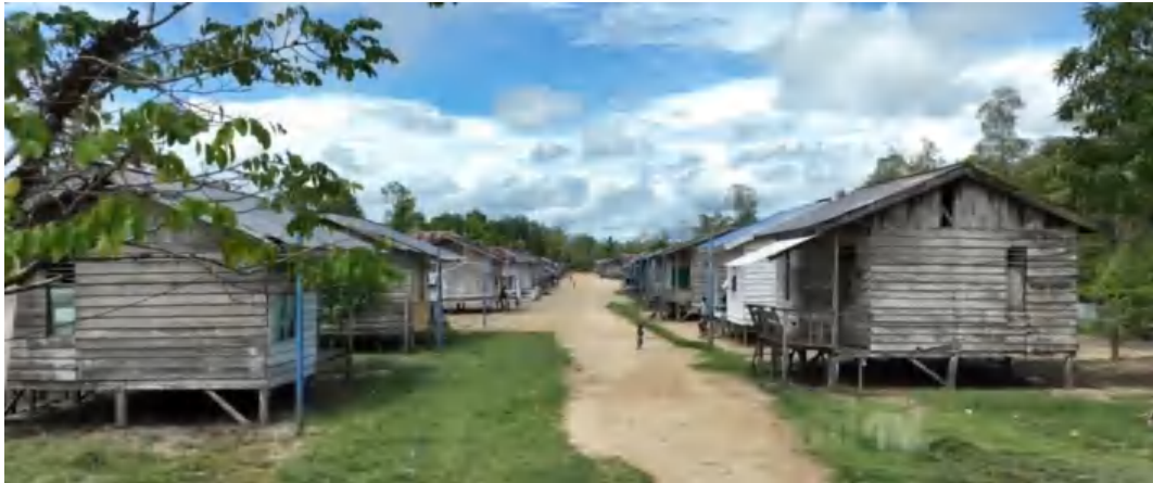
Permukiman Suku Kamaro di Kampung Nawaripi Pantai Distrik Mimika Timur Yang Terbatas Sarana dan Prasarana