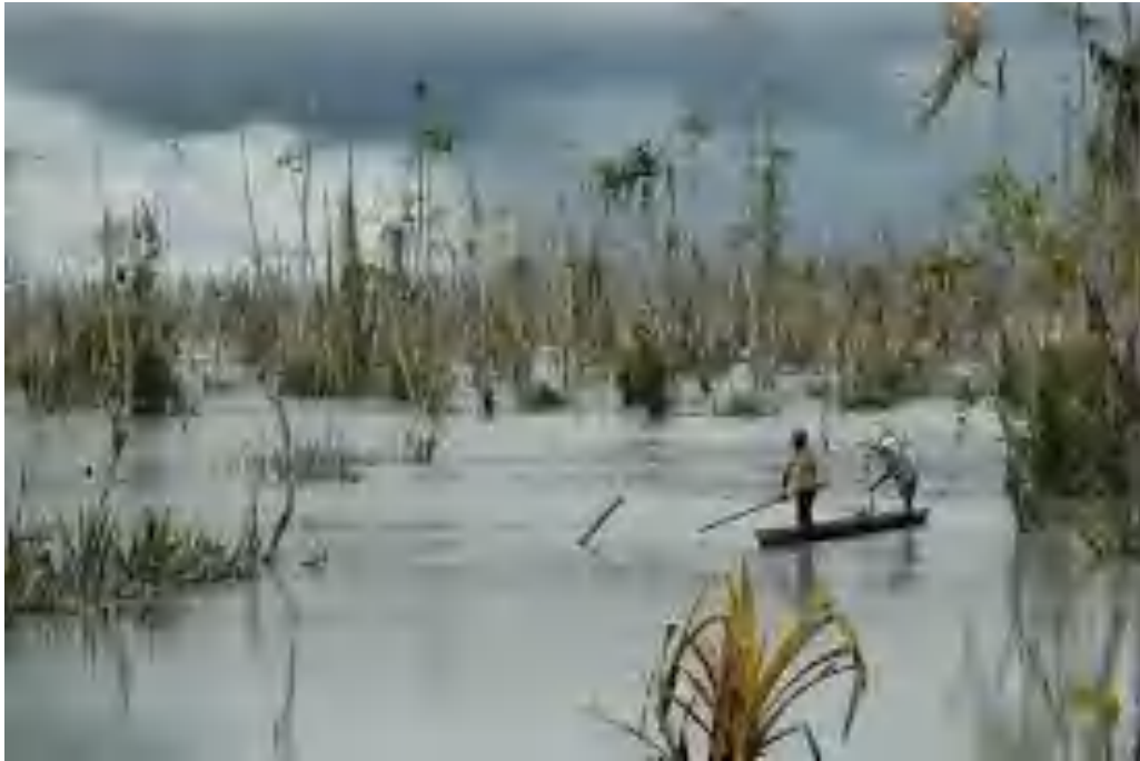
Lokasi Kerusakan Hutan Sagu dan Mangrove Akibat Dampak Pembuangan Tailing di Kampung Tipuka Papua