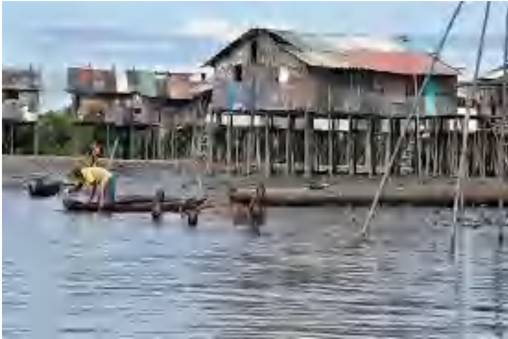
Kondisi Kehidupan Masyarakat Nelayan Sebagai Imbas Tailing Terjadi Pendangkalan Muara Sungai Dekat Dengan Lokasi PT Freeport Pelabuhan Portsaide