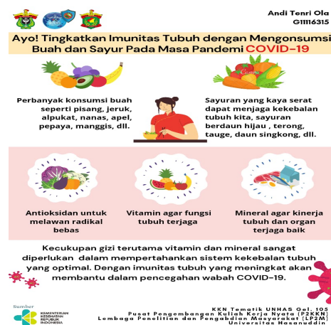
Gambar 2. Poster Digital