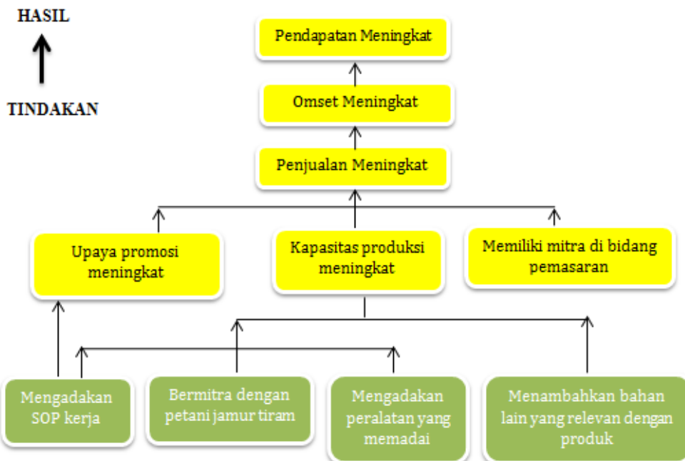
Gambar 4. Struktur Pohon Tindakan Usaha Abor