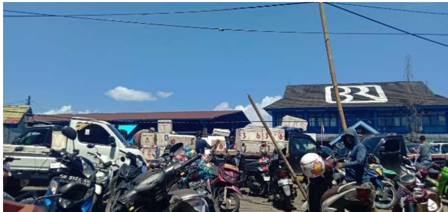
Tempat Pelelangan Ikan Paotere