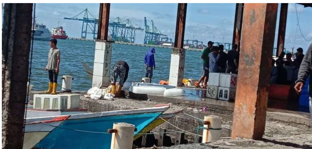
Proses Penurunan Ikan dari Perahu Nelayan