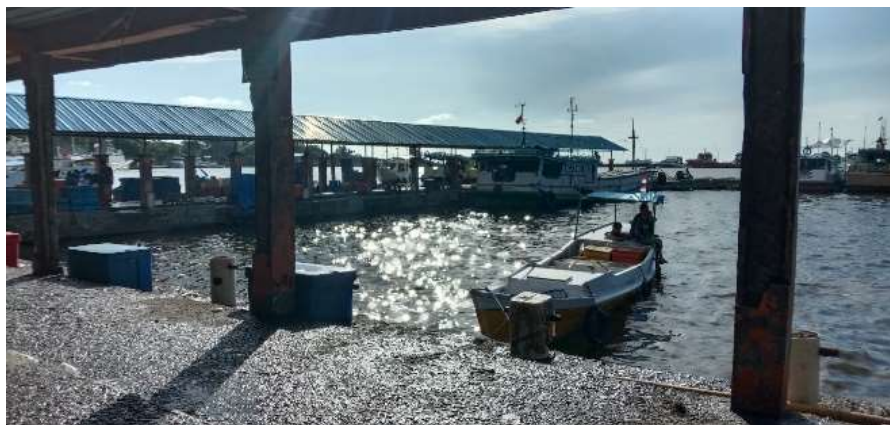
Dermaga PPI Paotere