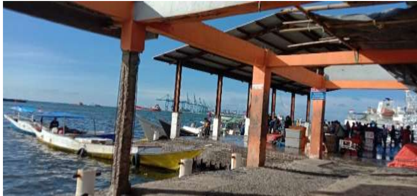
Hasil Tangkapan Nelayan