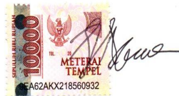
Hikmatun Bibi Qurais