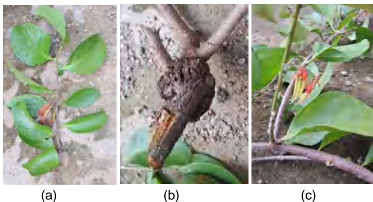
Gambar 1. (a) Daun; (b) Bonggol dan batang; (c) Bunga