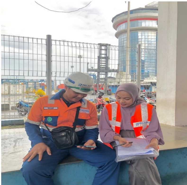
Gambar 2. Pengambilan data Pekerja Bongkar muat di PT. Pelindo