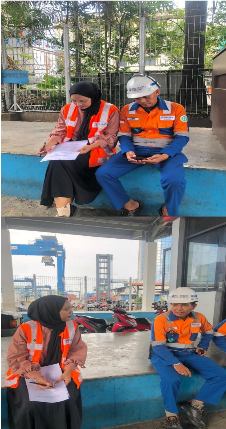
Gambar 3. Pengambilan data Pekerja Bongkar muat di PT. Pelindo