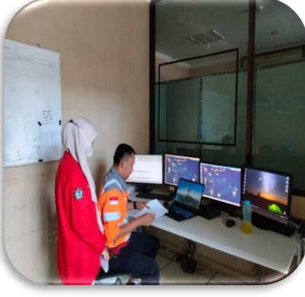
Gambar 6. Penelitian di CCR 5