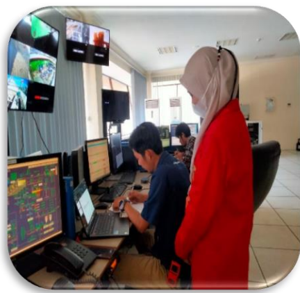
Gambar 5. Penelitian di CCR 5