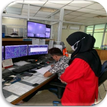
Gambar 1. Penelitian di CCR 2/3