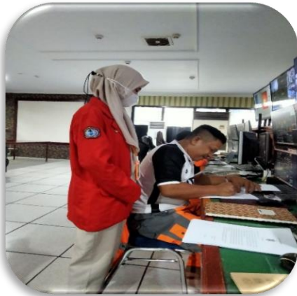
Gambar 3. Penelitian di CCR 4