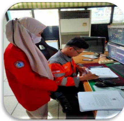
Gambar 4. Penelitian di CCR 4