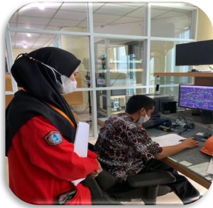
Gambar 2. Penelitian di CCR 2/3