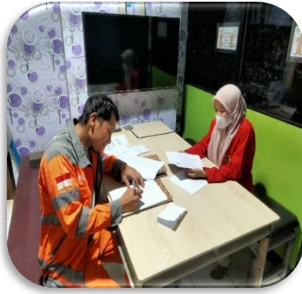
Gambar 7. Penelitian di RKC