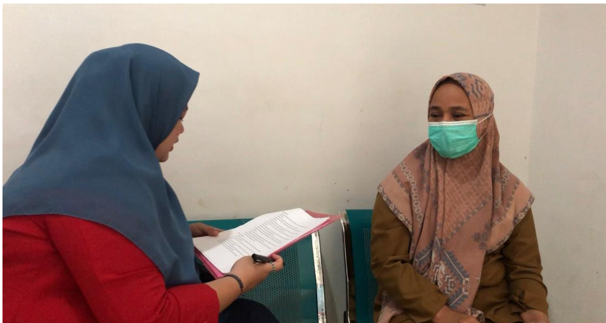
Wawancara dengan perawat Puskesmas Malimongan Baru