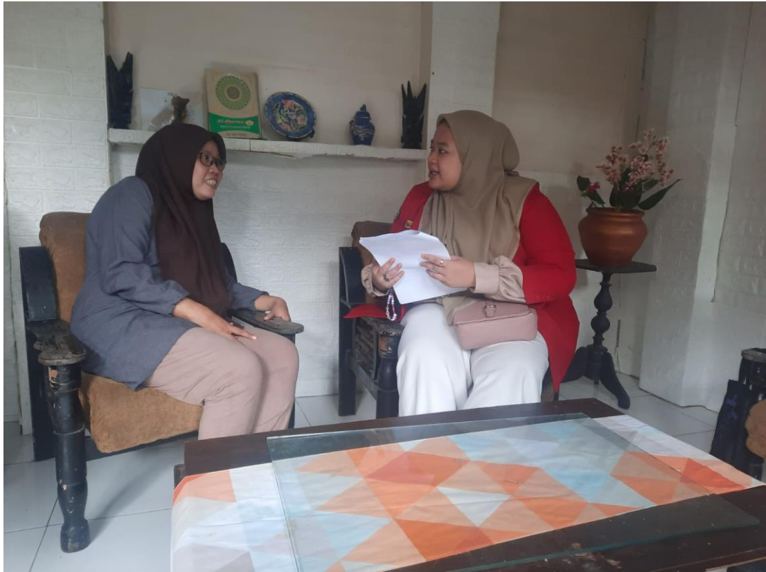
Wawancara dengan masyarakat