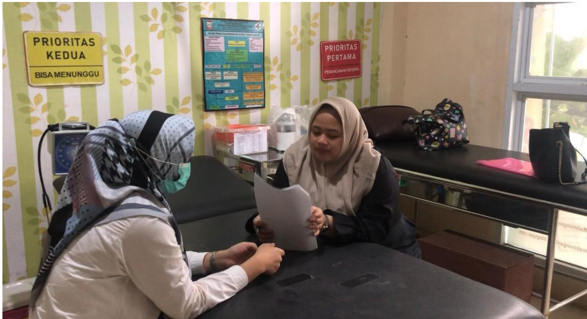
Wawancara dengan perawat Puskesmas Malimongan Baru