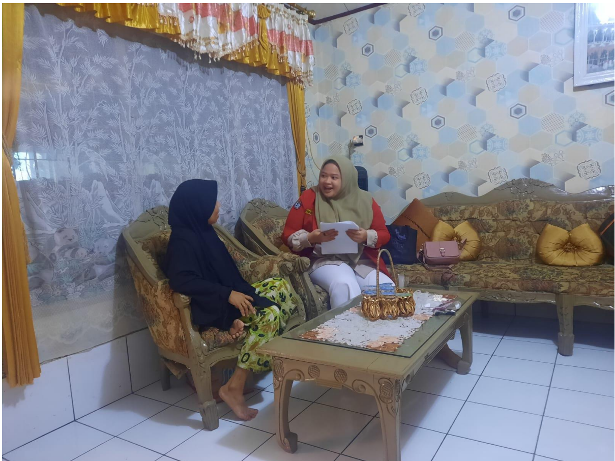
Wawancara dengan masyarakat