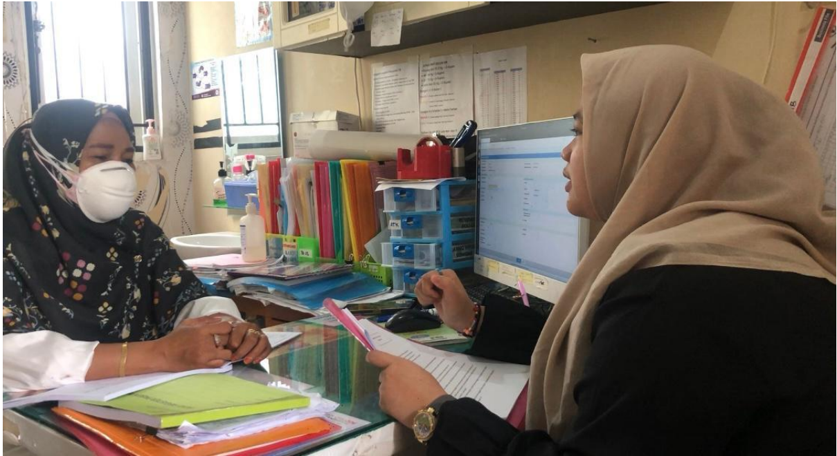
Wawancara dengan perawat Puskesmas Malimongan Baru