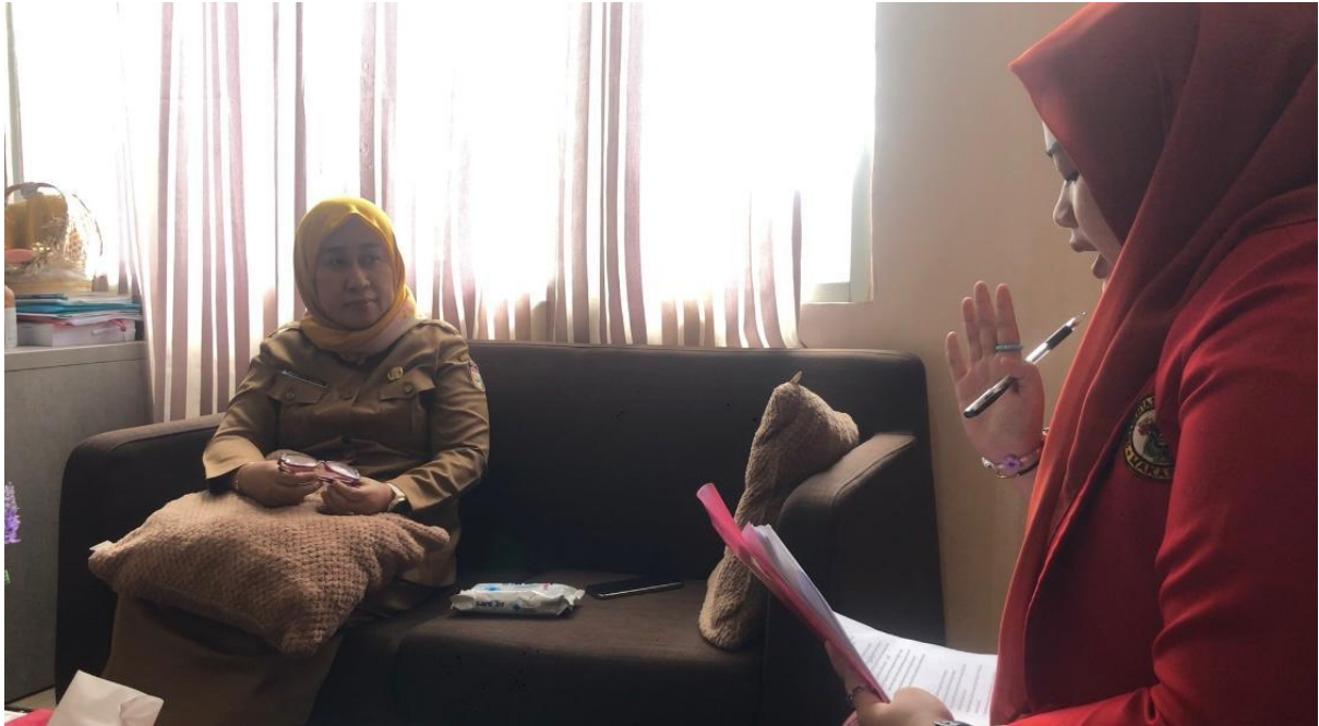
Wawancara dengan kepala UPT Puskesmas Malimongan Baru