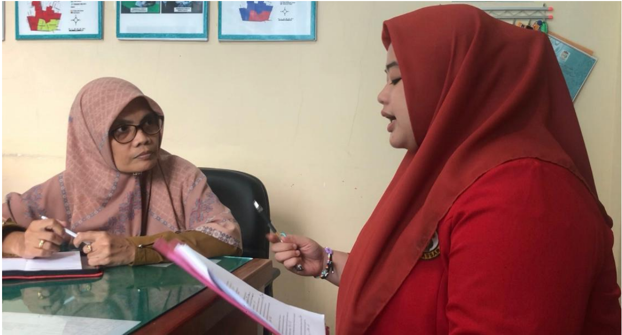
Wawancara dengan tenaga promkes Puskesmas Malimongan Baru