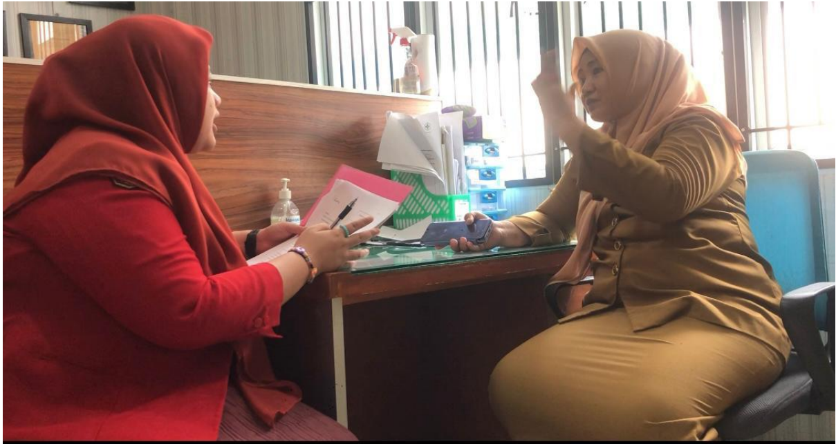
Wawancara dengan perawat Puskesmas Malimongan Baru