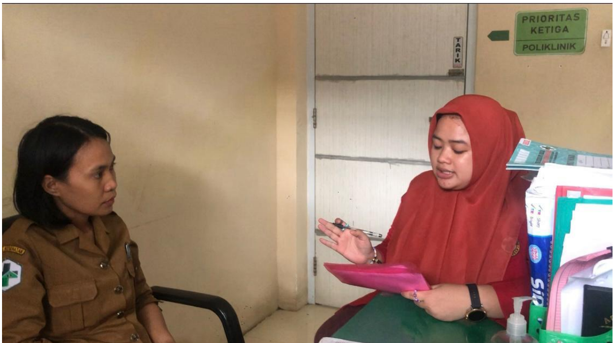
Wawancara dengan perawat Puskesmas Malimongan Baru