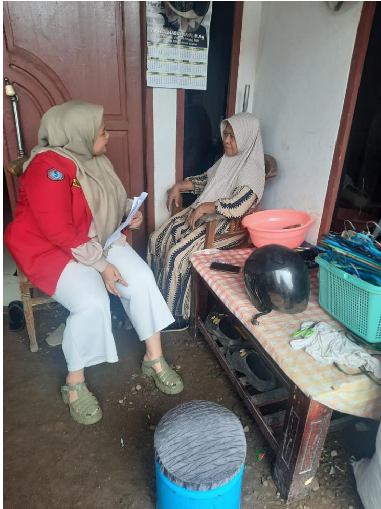
Wawancara dengan masyarakat