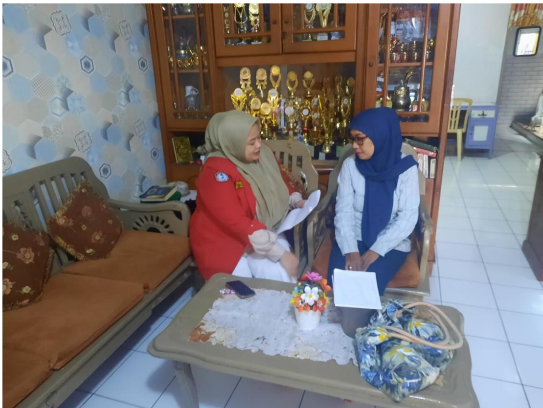
Wawancara dengan masyarakat