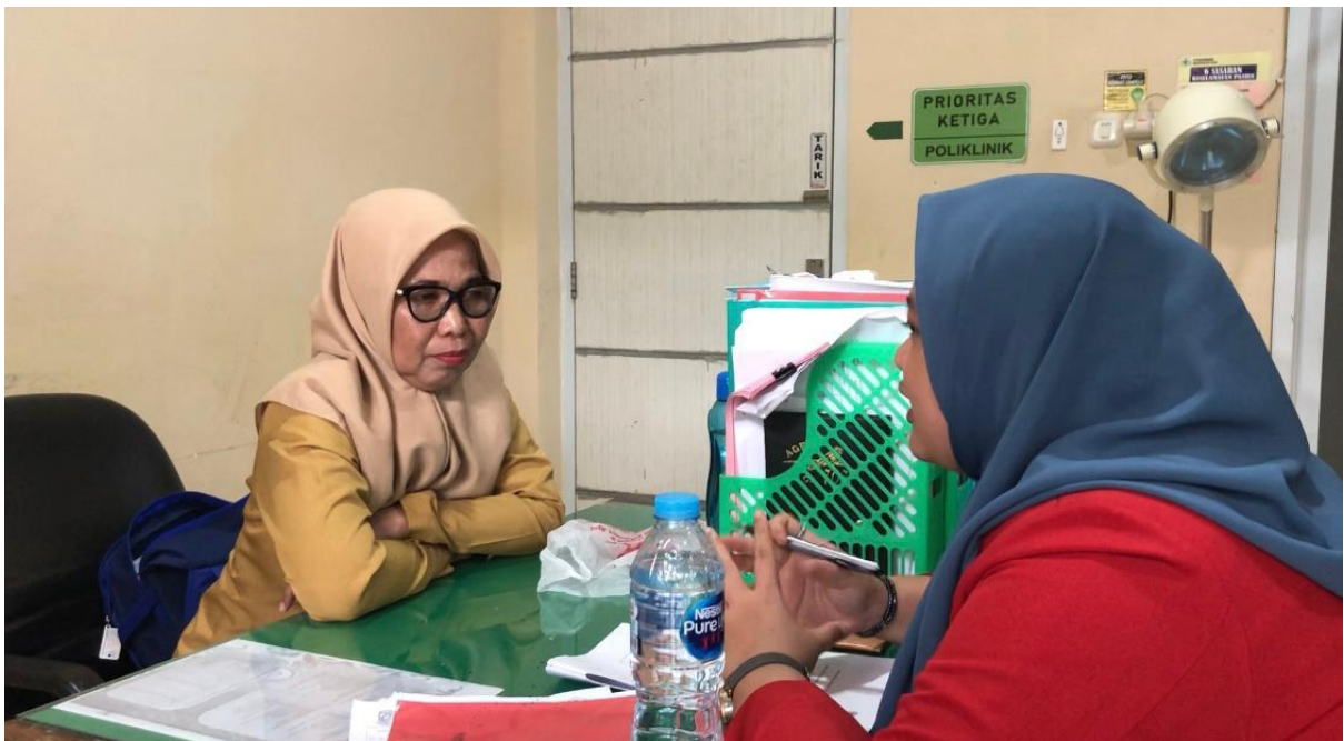
Wawancara dengan perawat Puskesmas Malimongan Baru