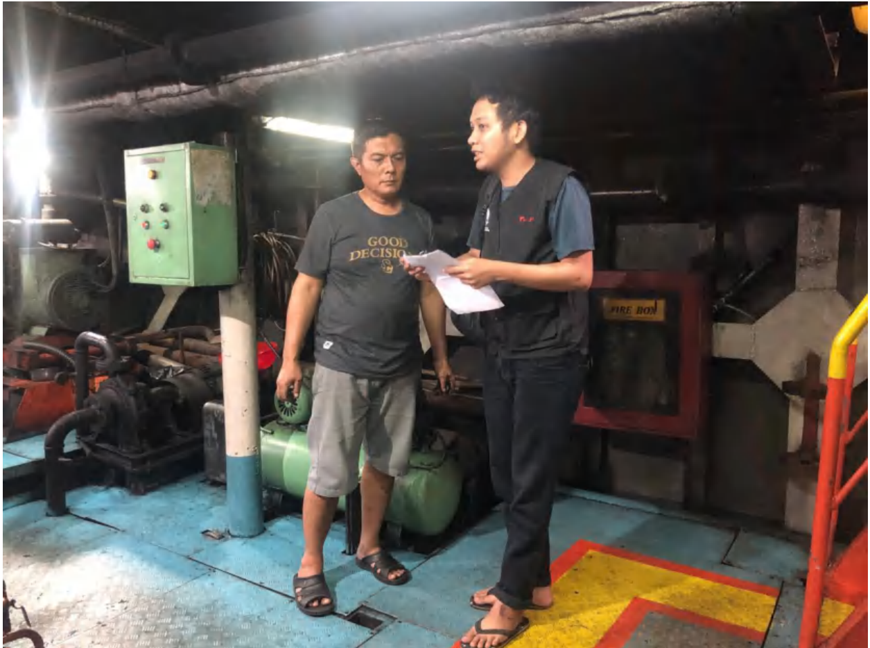
Lampiran 4. Pengambilan data koesioner terhadap ABK Kapal Awu aw