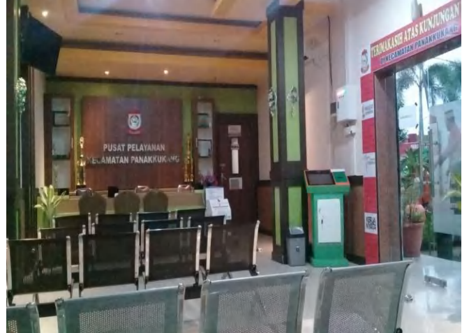
Ruang Tunjau Pelayanan