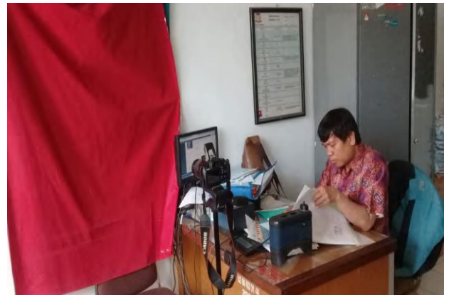
Ruang Pengambilan Foto, Sidik Jari, Pengimputan Data dan Pencetakan.