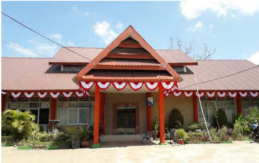
Kantor Kecamatan Panakkukang