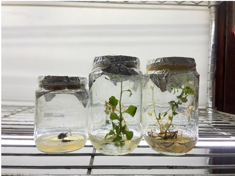
i3 (Lama Perendaman 12 jam)