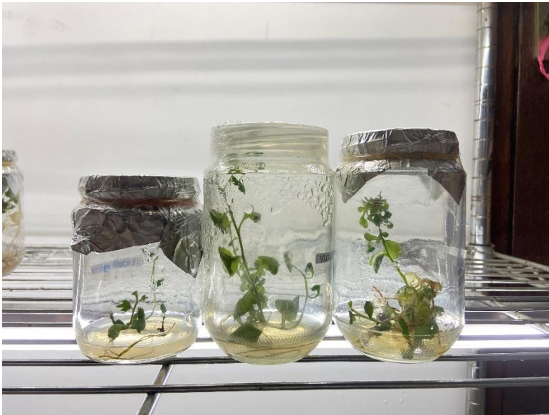
i1 (Lama Perendaman 4 jam)