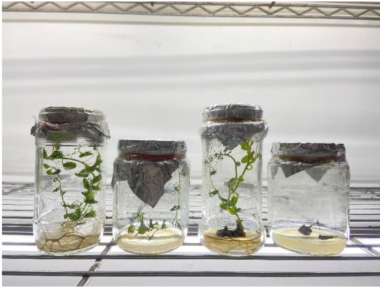
v1 (Varietas Pinka Pinky)