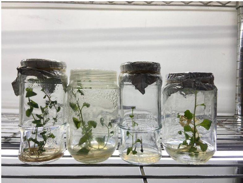
v2 (Varietas Lolipop)