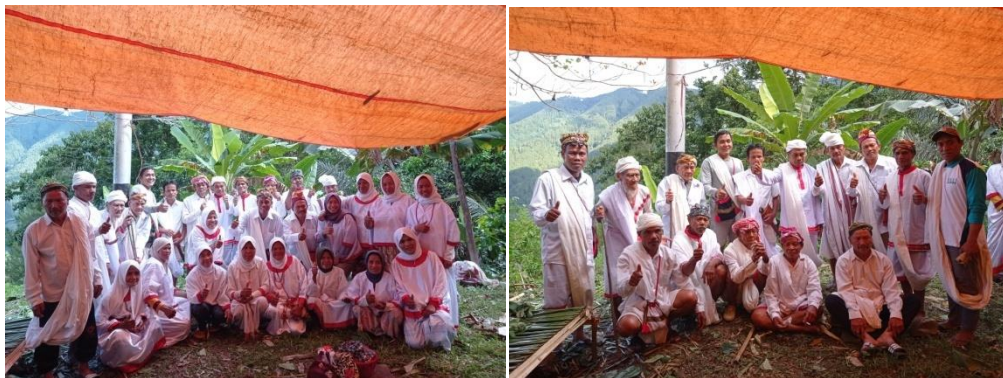
Ket.: Peserta dalam kegiatan pesta panen