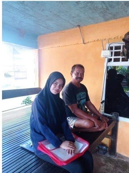
Ket.: Wawancara dengan Pak Sukarno