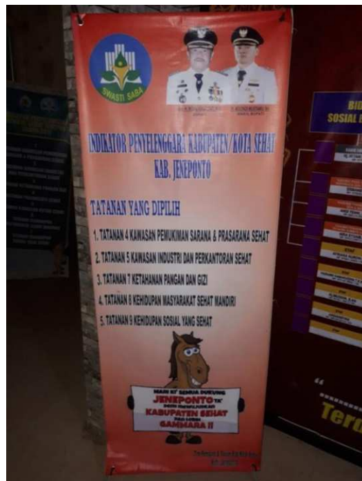
Dokumentasi Info dan Pengumuman Visi dan Misi serta Program Kerja Pemerintah Daerah di Kantor Bupati Jenepono.