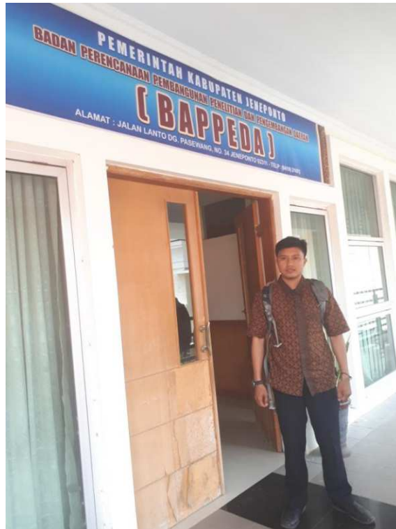
Dokumentasi Saat Peneliti berada di Kantor Bupati Jeneponto.