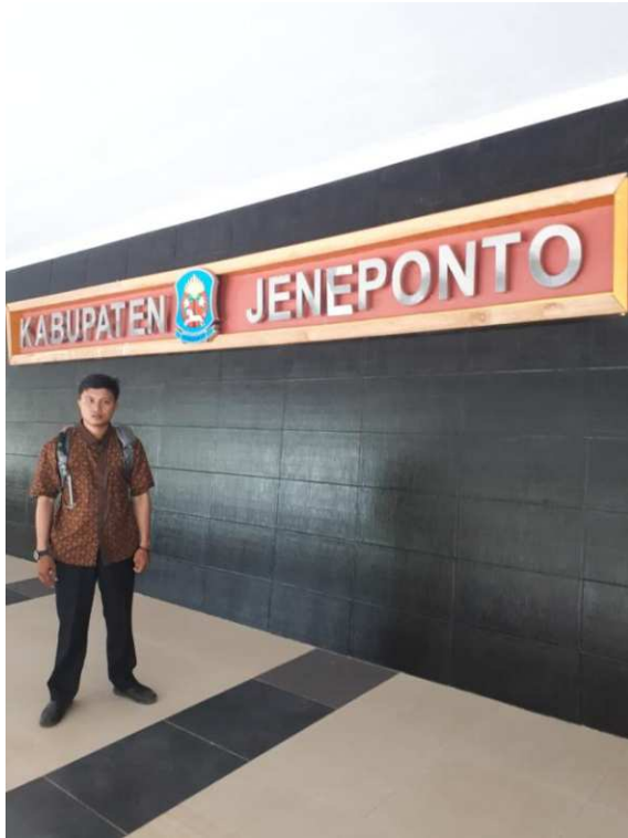
Dokumentasi Saat Peneliti berada di Kantor Bupati Jeneponto.